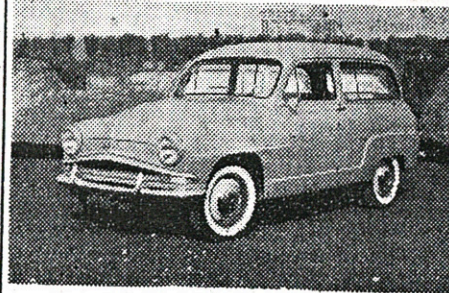
A pagina 3