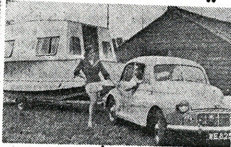
A pagina 7