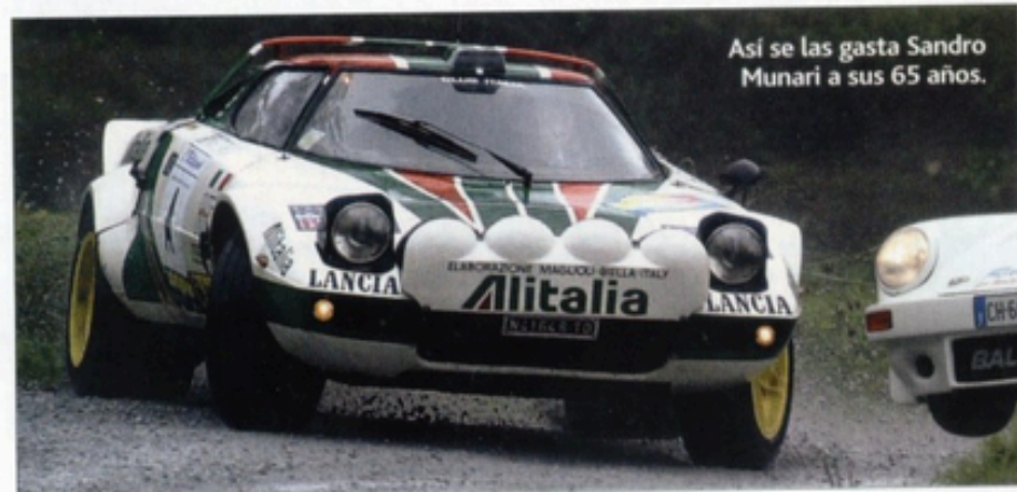
Así se las gasta Sandro Munari a sus 65 años.