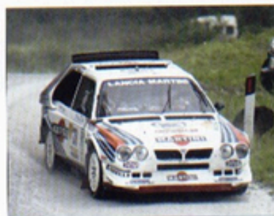
Los gentlemen drivers disfrutan de lo lindo enfrentándose a sus ídolos de siempre con sus propias armas.

la pasión por este deporte puede reunir en un parque cerrado a varios campeones del mundo, a humildes aficionados con sus Minis y Escort y a los dueños de algunas de las grandes fortunas del norte de Italia? Uno de los responsables del rallye preguntaba a un periodista acreditado su opinión sobre la prueba: "¿bello?". La respuesta del periodista podría ser la nuestra: "¡Troppo bello!" (demasiado bonito). □