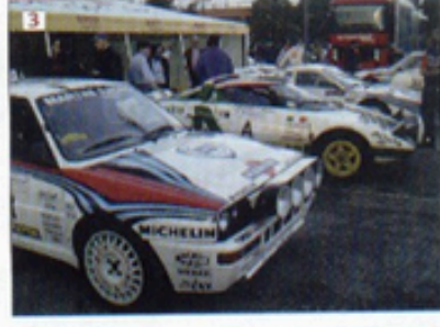
1. Alen-Kivikami, una pareja legendaria en la historia de los rallyes.