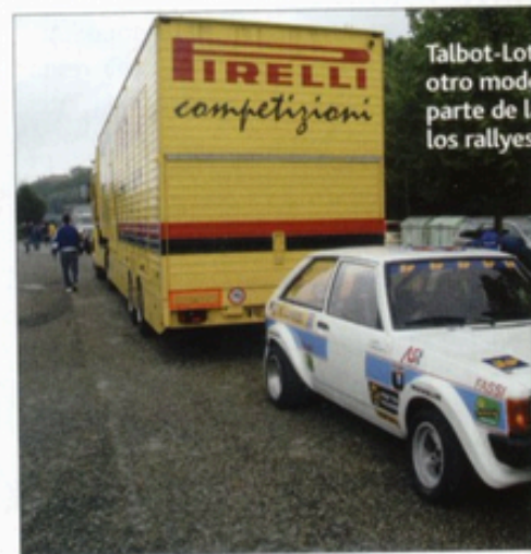
Talbot-Lotus otro modo parte de los rallyes