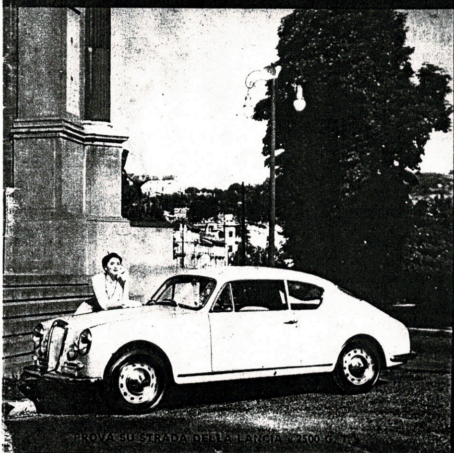
PROVA SU STRADA DELLA LANCIA 2500 G. T.