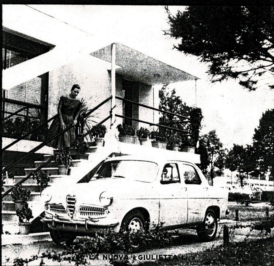
LA NUOVA GIULIETTA