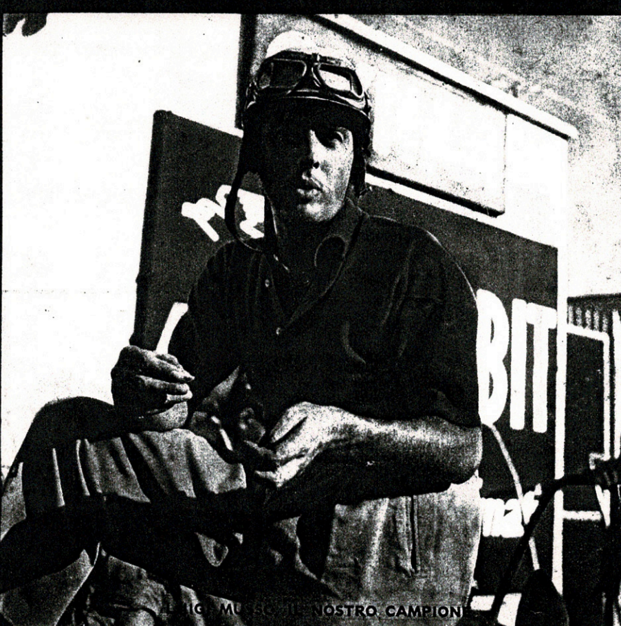
IL NOSTRO CAMPION