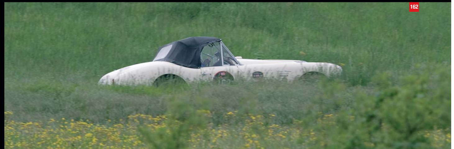
Webb (GB) Metcalfe (GB) 161 JAGUAR C-type (1952) Francis (CDN) Francis (CDN) 164 ALLARD J2 (1951) Keil (D) Keil (D) 160 JAGUAR-BIONDETTI Special (1950) Kersten (NL) Bodewes (NL) 163 TALBOT LAGO T26 Grand Sport (1950) Gamberini (I) Nobili (I) 162 HEALEY NASH mod.S1 Roadster (1951)