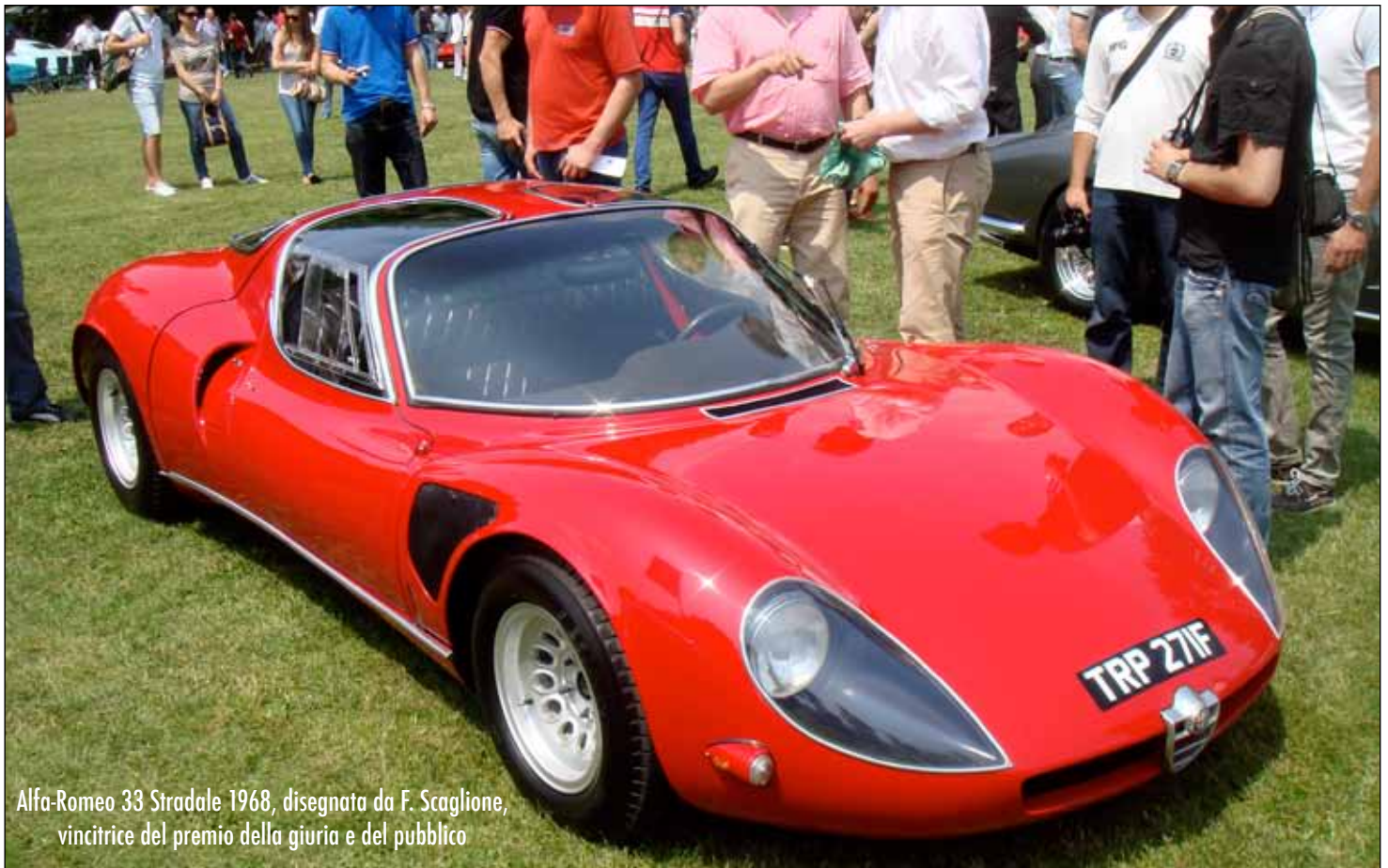
Alfa-Romeo 33 Stradale 1968, disegnata da F. Scaglione, vincitrice del premio della giuria e del pubblico