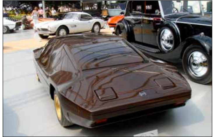
In alto, da sinistra, quattro prototipi di Bertone messi all'asta: Lancia Stratos HF Zero 1970, Lamborghini Athon 1980, Chevrolet Testudo 1963 e Lancia Sibilo 1978. In basso, seguono: Alfa-Romeo 2000 Praha Touring 1960, Lancia Aurelia B 24 S America 1955, Hispano Suiza K6 1936 ed Alfa-Romeo 6C 2500 SS Bertone 1942.