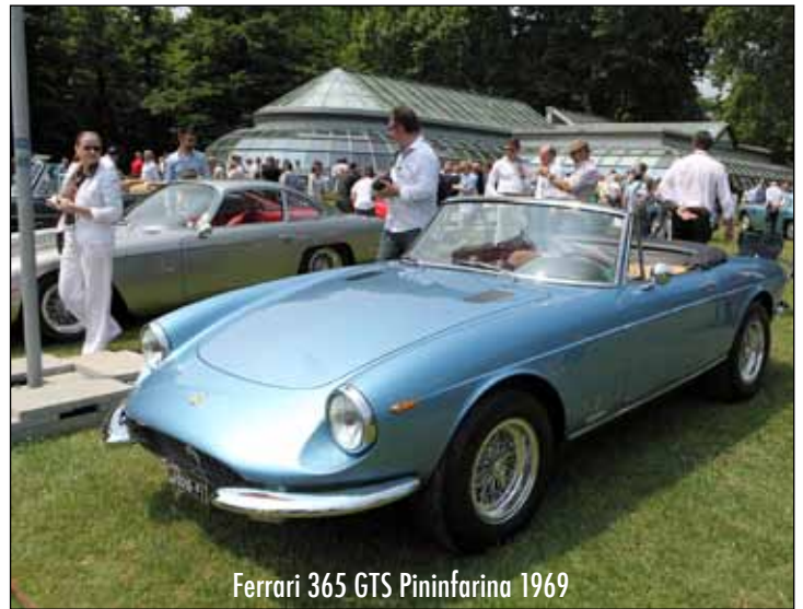
Ferrari 365 GTS Pininfarina 1969