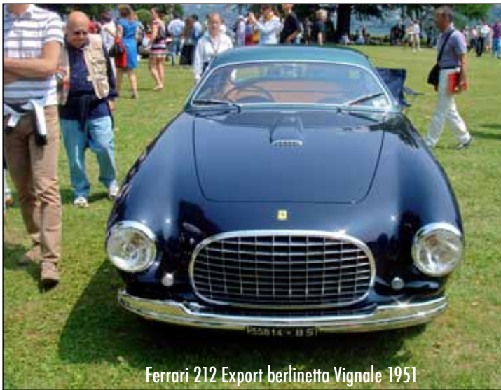
Ferrari 212 Export berlinetta Vignale 1951