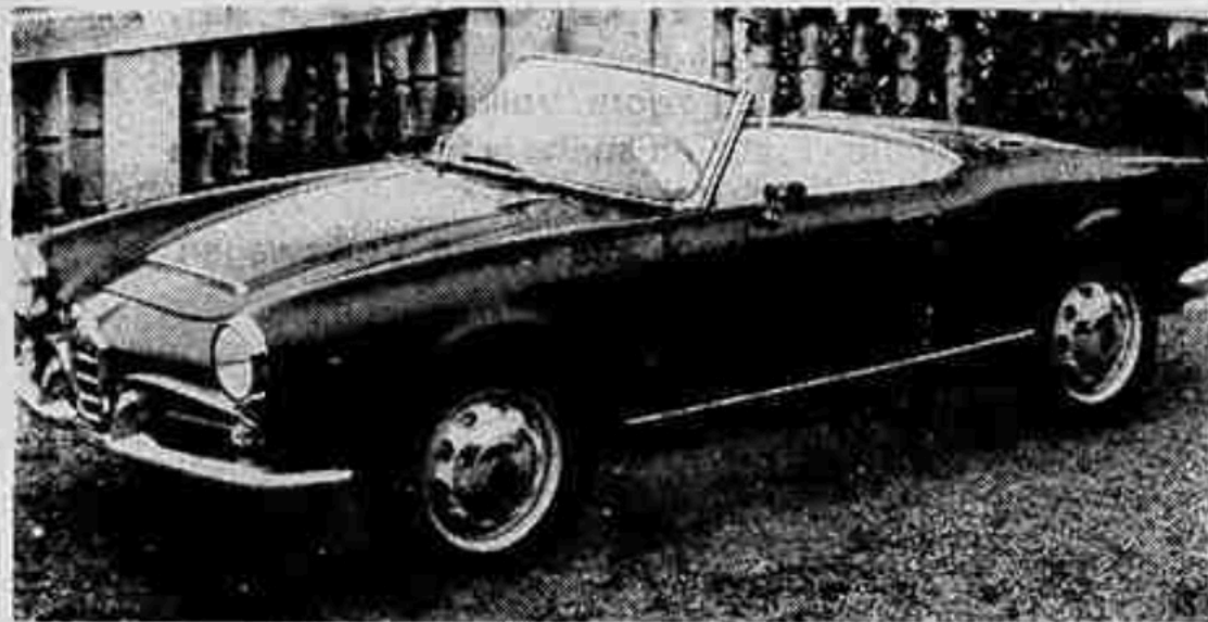
Lo scattante spider 2 posti su Alfa Romeo Giulia

Ne stanno parlando i giornali di tutto il mondo, di questa realizzazione della Pininfarina, che sta dando un'impronta particolare a questa interessantissima 45ª edizione del nostro Salone.