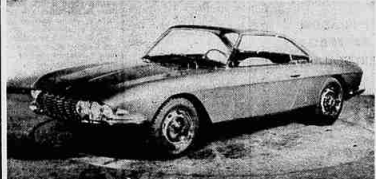
Coupé spaziale su Fiat 2300 denominata Lausanne 64