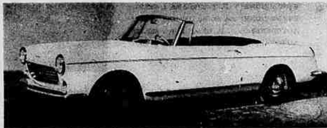
L'elegante coupé e cabriolet su Peugeot 404