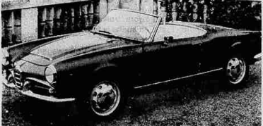
Lo scattante spider 2 posti su Alfa Romeo Giulia

Altri modelli di grande interesse sono il Coupé Spioletta o 3 posti in telaio Lancia Flaminia 2.8, modello di particolare eleganza sportiva. Il veniamo alla vettura della sicurezza, la ormai famosa e PF Sigma. Si tratta di uno studio di carrozzeria nel quale sono stati im-