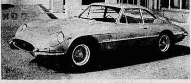
Coupé spaziale 2 posti su Ferrari 400/8A Supersprint