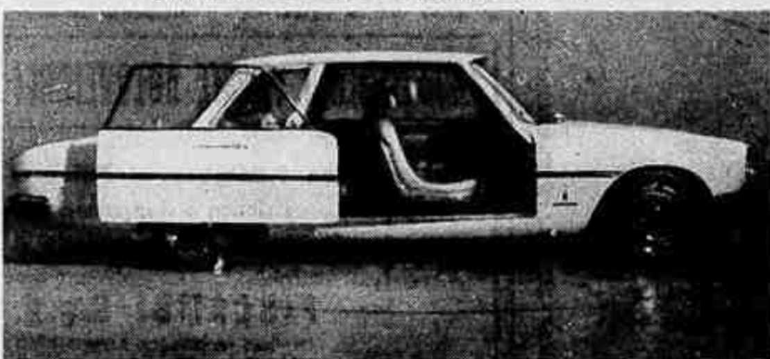
PF Sigma: è stata definita l'auto della sicurezza