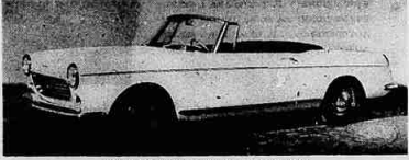
L'elegante coupé a cabriolet su Peugeot 404