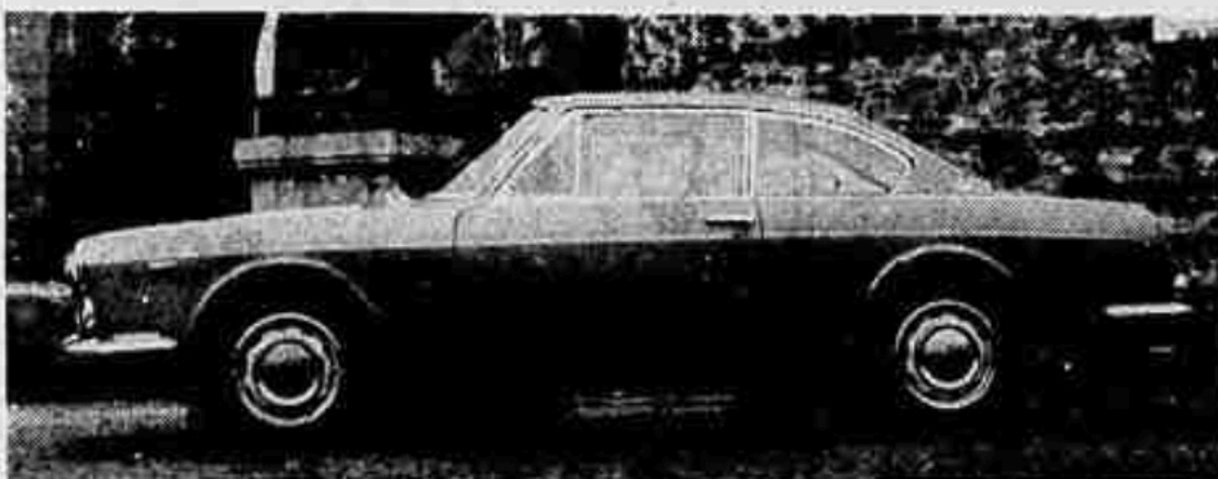
L'affermato coupé 2+2 su Lancia Flavia