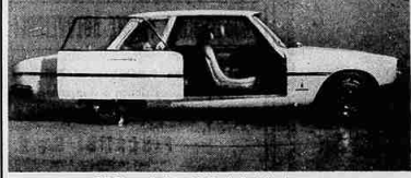
PF Sigma: è stata definita l'auto della sicurezza