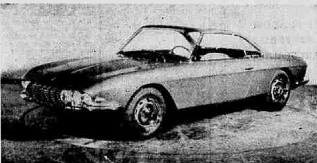
Coupé speciale su Fiat 2300 denominata Lausanne 64