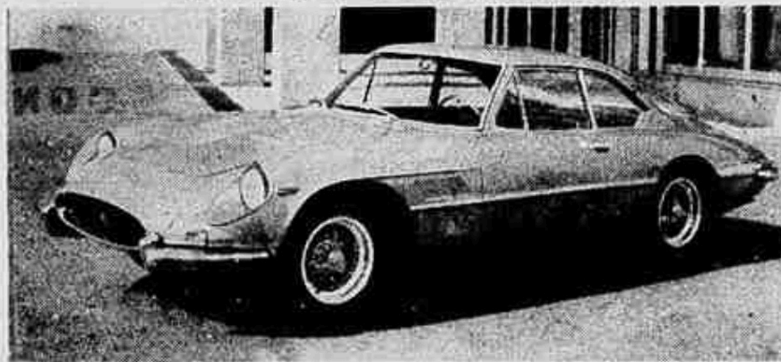
Coupé speciale 2 posti su Ferrari 400/5A Superamerica