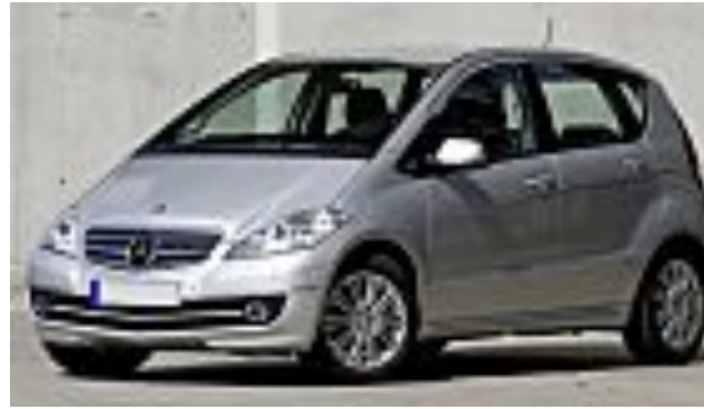
Le 5 peggiori auto degli ultimi 10 anni (Topfive.it)