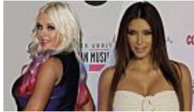
Ecco come essere sensuali anche con qualche taglia (e chilo) di troppo (Style)