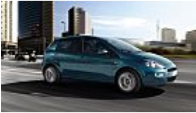
Fiat Punto - Addio ai diesel e alle tre porte (Quattroruote)