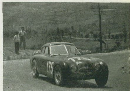
Bernabei Cisitalia, terzo nella classifica generale.