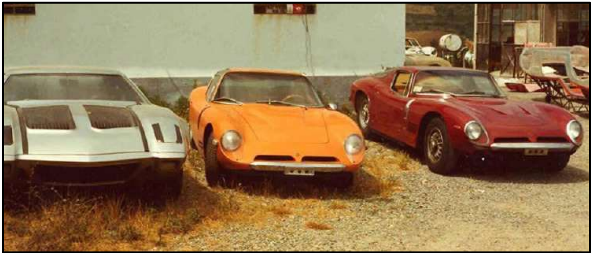
Vor der Werkstatt von Giotto Bizzarrini