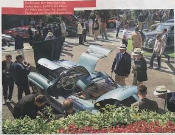
Historiker: Wie Sammler, sie haben Kunst, sind in den Parks. An Villa von Capri, Cortina, Fieschi und Albi. Privatbesitz.