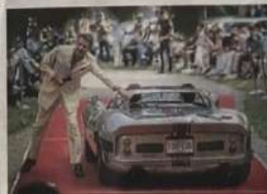
Die Formel 1 ist ein Werk des Motorsport-Genies Enzo Ferrari.

Es gibt eine neue Generation von Sammlern mit neuen Vorlieben