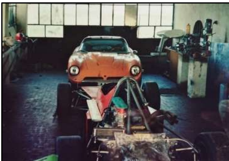
In Bizzarrinis Workshop