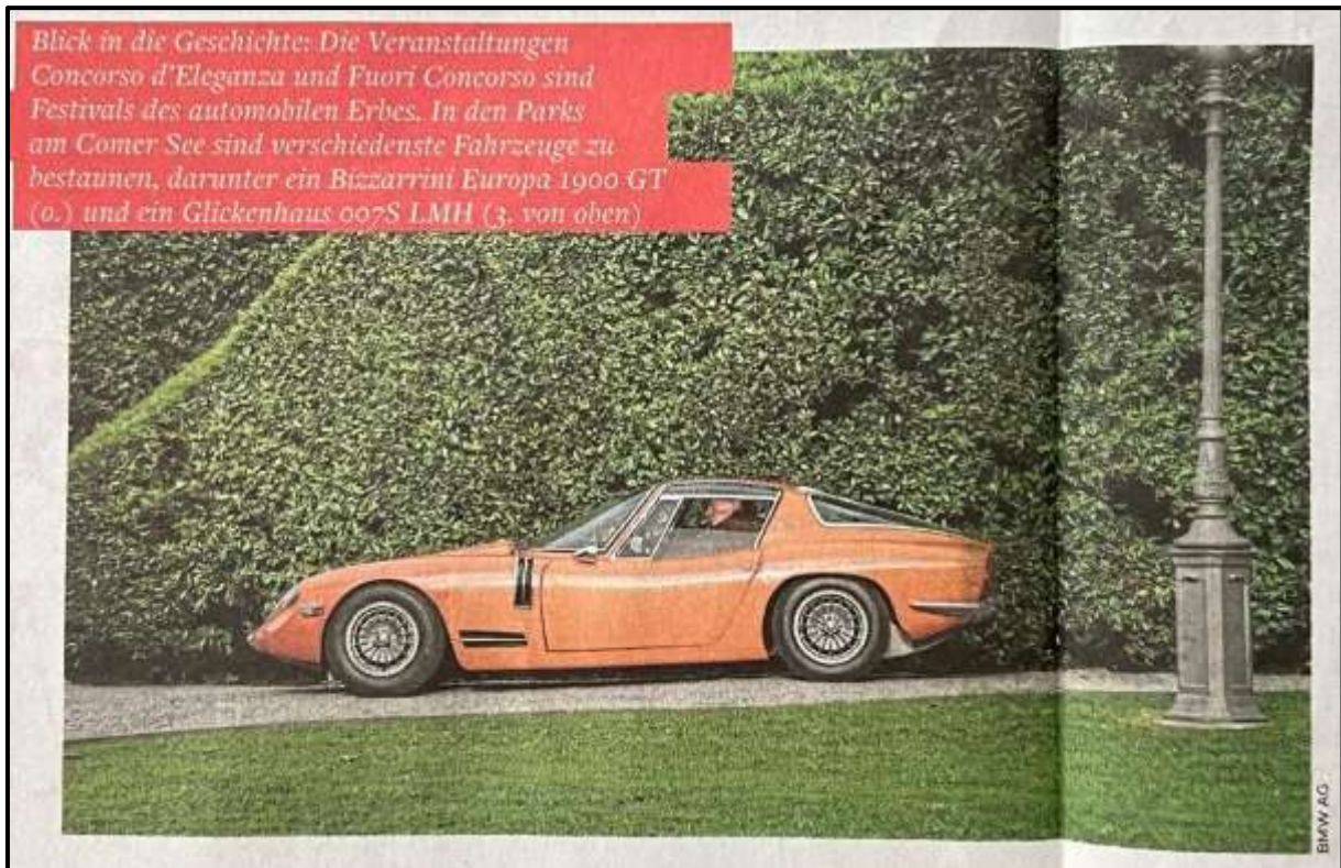
#507 at the 2025 Concorso d'Elegance at Villa d'Este