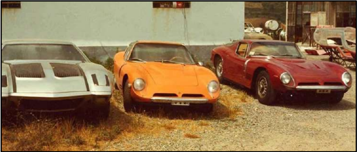
In front of Giotto Bizzarrini's workshop