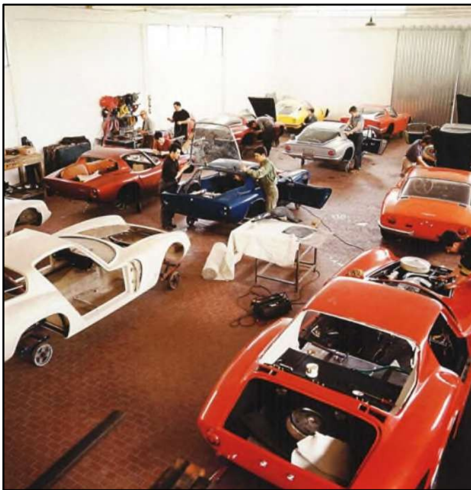
In Giotto Bizzarrini's workshop / Production of the 12 factory-built Bizzarrini Europa