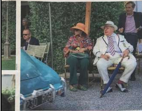
Erster Schritt: Die Autoschreck, Garwin, Schipani und andere in der Galerie und im Clubhaus.