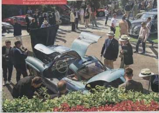
Hochzeit: Wie Amalick, der seinen Auto Club in den Park an Villa von Camer See, Garwin, Frank und Alex Privatklub zusammen.