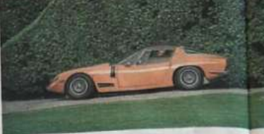
Die Formel 1 ist ein Werk des Motorsport-Genies Enzo Ferrari.

Jedes Jahr gibt es mehr Marken in die sich im Licht dieser mediterranen Perle spiegeln wollen. Es ist eine Mischung aus Bonaparte, den schicksten, teuren Milliardäreinkaufsstellen, wo Mini zu Hause ist, und einer geradem obensten Gemähten: wirklich nur das Beste vom Besten ist es schon zu stellen. Denn dabei ist Bonaparte, die perfekten Espresso hat mit Sandwiches im Schatten stieliger Villen-Festern. Nichts außer das Auge auf dem See nach die Riva-Boote und Bootschiffe. Und er ist jeder in, sammeln Mini Autos, „also, bevor alle so teuer wird“, wie er glänzend hinaus-