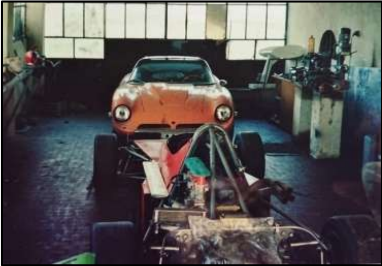
In Bizzarrini's workshop