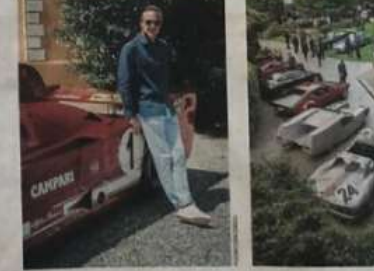
Die Formel 1 ist ein Werk des Motorsport-Genies Enzo Ferrari.