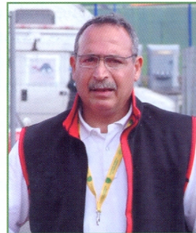
di Salvatore Calvaruso

Questa riflessione sull'artefice di una delle più belle auto al mondo, è maturata osservando le auto portate in mostra dall'ASI in occasione di "FUORISERIE 2012", rassegna motoristica dedicata al collezionismo d'epoca svoltasi presso la Fiera di Roma. Delle due auto presenti, vere concept car dei tempi in cui sono state realizzate, la più rimarchevole era la LANCIA 6c 2500 SS Bertone del 1942, unico esemplare esistente, restaurato in modo impeccabile e di straordinaria bellezza. Osservandola, si ripercorrono le tappe più significative di un'epoca in cui la voglia di riscatto e rinascita degli italiani esaltarono la creatività e la tenacia di uomini come lo stilista torinese e il suo staff. L'auto rappresentò per quei tempi l'innovazione stilistica del design mondiale, tanto che alla presentazione fece improvvisamente invecchiare tutto il parco macchine di quel momento. Nonostante le immagini esposte, risalenti al periodo di restauro, abbiano dato al visitatore la chiara dimensione dell'impresa e fatto comprendere il valore artistico dell'oggetto esposto, è innegabile che soltanto osservandola da vicino si abbia l'esatta entità dell'elevatissimo pregio dell'opera; se è mai stata realizzata un'auto che non ha tempo, questa è proprio l'Alfa Romeo 6c 2500 SS Bertone del 1942. A distanza di settant'anni, quest'automobile trasmette al visitatore sensazioni superiori a quelle che può offrire la più moderna realizzazione automobilistica. Non è da escludere che