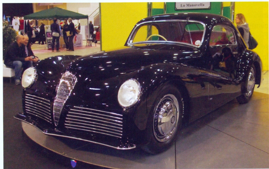
Alfa Romeo 6c 2500 SS Bertone 1942. Chassis: 915516. Engine: No 923616.