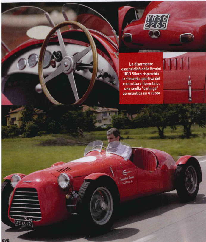
La disarmante essenzialità della Ermini 1100 Siluro rispecchia la filosofia sportiva del costruttore fiorentino: una snella "carlinga" aeronautica su 4 ruote