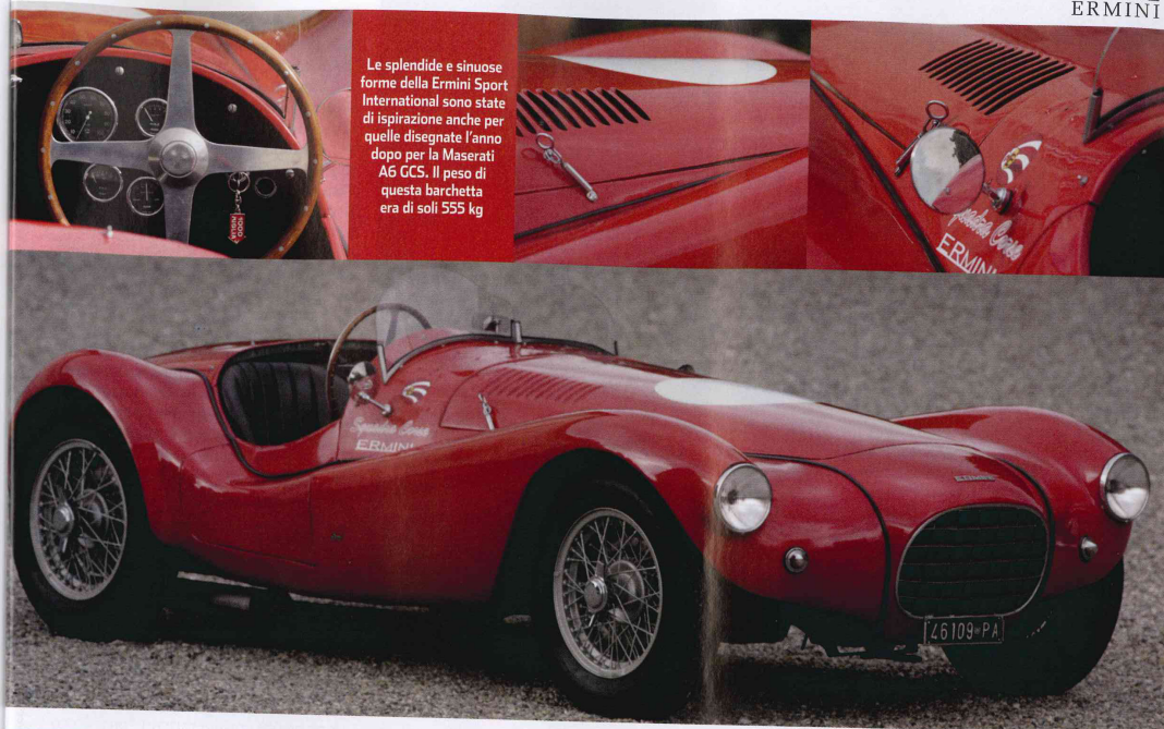
Le splendide e sinuose forme della Ermini Sport International sono state di ispirazione anche per quelle disegnate l'anno dopo per la Maserati A6 GCS. Il peso di questa barchetta era di soli 555 kg