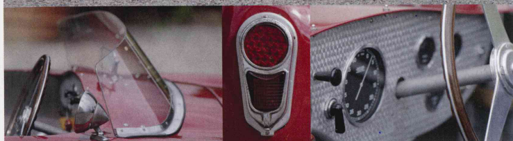
La Ermini 1100 Fiat-S.V.A. è stata realizzata dalla Carrozzeria Motto che, lavorando anche per la Caproni Aeronautica, ha impiegato traversine forate per aerei sulle strutture delle portiere