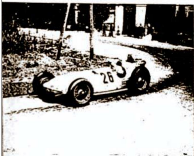
La perfetta aderenza della Mercedes di Caracciola in curva.

La corsa delle macchine formula ha offerto infatti spunti di emozione e di tifo specialmente per merito della Maserati e della rivelazione Gigi Villoreti, il giovane pilota delle 1500 che al suo esordio nelle grosse cilindrate si è rivelato pilota completissimo e di sicuro affidamento per le imprese più grandi. Come diremo più avanti, Villoreti ha sostituito al