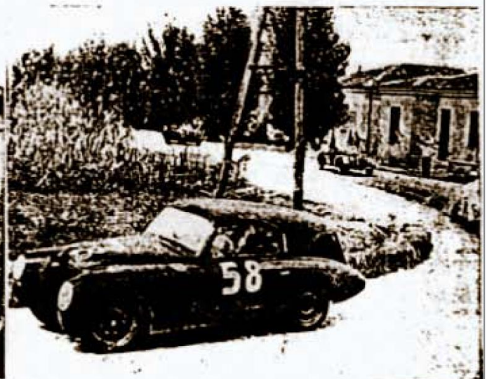
Un passaggio delle vetture della classe Sport durante la « 6 ore ».