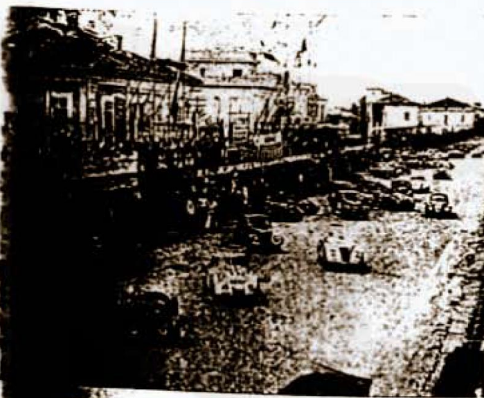
La spettacolare partenza per la « 6 ore » delle 54 vetture concorrenti.

Tra le 750 dopo le prime due ore di corsa, Baravello-Sola