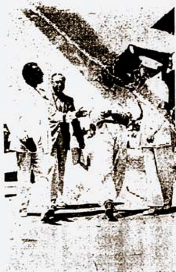
Giuseppe Farina che con la Alfa Corse ha conseguito un ottimo secondo in classifica dopo una gara calma e decisa.

La «Sei Ore» ha raccolto ben quarantaquattro vetture, ed i risultati sono notevolissimi in quanto tutti i vincitori hanno superato largamente i chilometraggi dello scorso anno, che già erano rilevanti. Le piccole macchine di 750 hanno nella attuale edizione superato i 95 giri, le 1100 i 104, le 1500 i 108 e le macchine di oltre 1500 i 111, velocità queste che conseguite attraverso sei ore di marcia, con delle vetture abbastanza normali e su un percorso che ha permesso a vet-