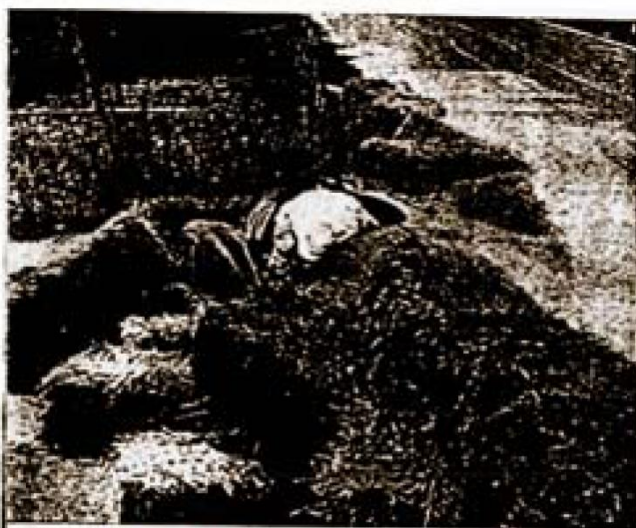
evazione tra le balle di paglia di un fuoristrada.

Al via Brauchitsch è il più pronto ad avviarsi seguito da Lang, Nuvolari e Caracciola. Al primo giro le tre Mercedes sono in testa seguite da Nuvolari e Müller, da Farina tutti