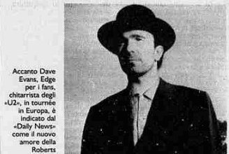
Accanto Dave Evans, Edge per i fans, chitarrista degli U2, è indicato dal «Daily News» come il nuovo amore della Roberts

Il quotidiano precisa che la ventitreenne attrice americana è legata da un'amore di lunga data con Dave Evans (questo il suo vero nome), il cervello del gruppo rock irlandese, divorziato dalla moglie. Ma ha trovato degli occhi di nota, come notizia di apertura nella pagina dei pettegolezzi, che la bella Julia ha preso un «Concorde» per recarsi a Parigi ed essere al suo fianco alle feste per il lancio del capitolo europeo della tournée.