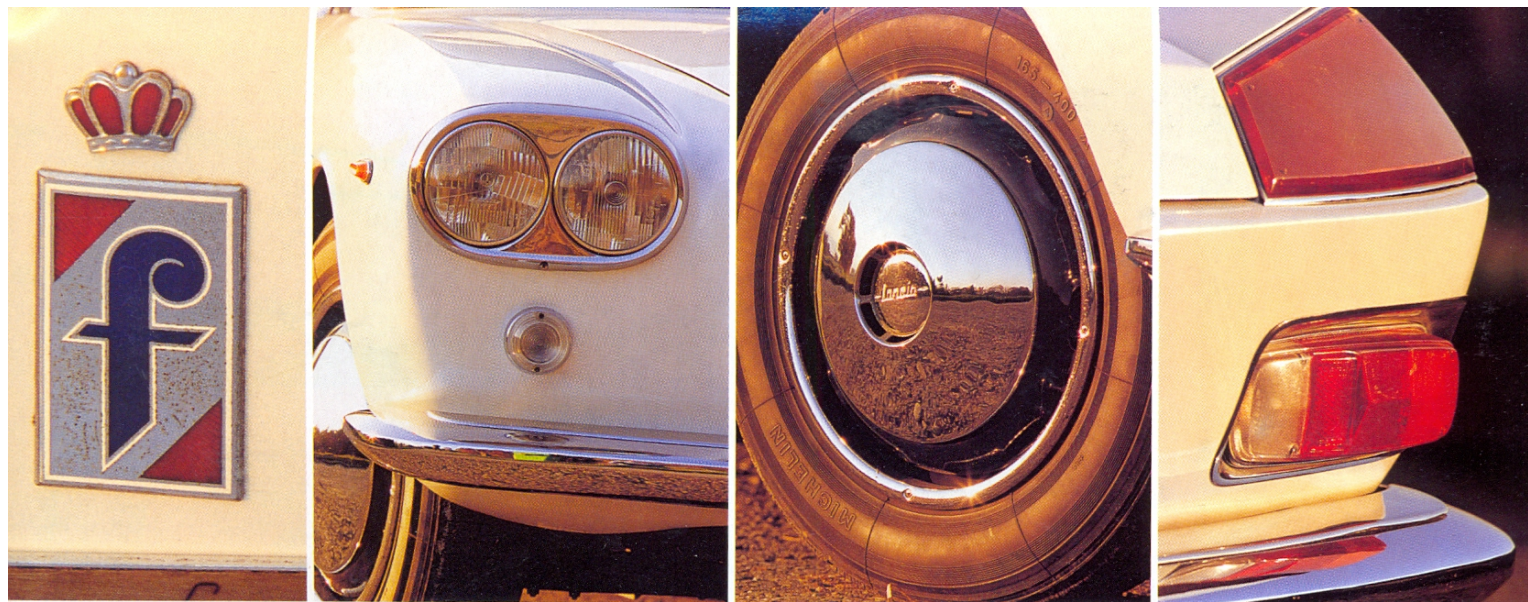
Unter den feinen Details des Prototypen stechen die doppelten Heckleuchten (Foto rechts) am meisten ins Auge. Der Original-Entwurf hatte nur die oberen Leuchten, für die Straßenzulassung wurden unten die Lampen eines Flavia Coupé nachgerüstet. Sie verschandeln den edlen Rücken

bezaubert die Flaminia beim Live-Kontakt noch mehr als auf Fotos. Durch den hochgezogenen Schweller aus poliertem Aluminium und die über die ganze Länge laufende Lichtkante wirkt die Seitenansicht rank und schlank.