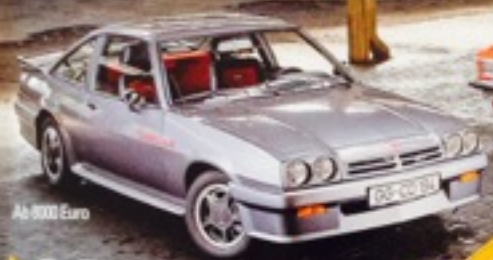
Ab 8000 Euro

Gewinnen Sie einen von 15 Startplätzen mit Ihrem Auto bei den Classic Days am Schloss Dyck!