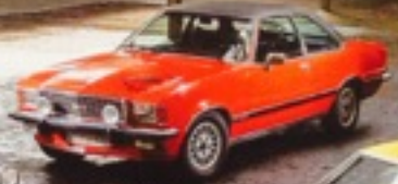
Ab 10 000 Euro