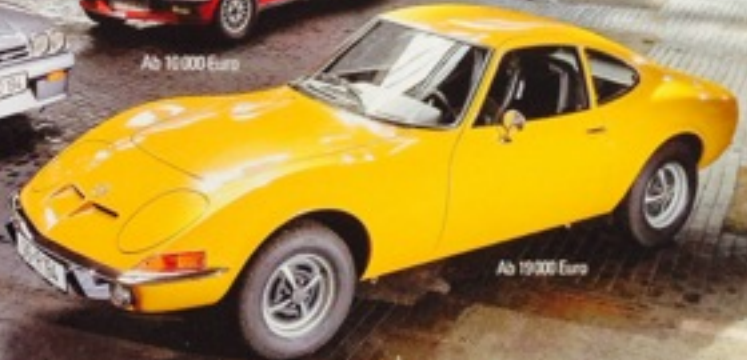
Ab 19 000 Euro