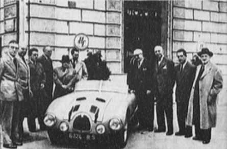
Partenza della Gordini da Parigi. Una delle due 2300 francesi con alcune personalità del mondo automobilistico parigino, tra cui Behra (il secondo da destra) e Gordini (il primo da sinistra) prima di lasciare la Francia.