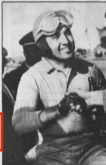
Alberto Ascari (campione d'Italia e del mondo).