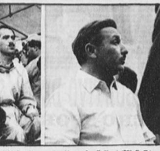
Casella (750 Sport).