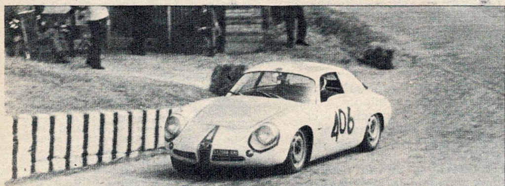
Antoniucci (Giulietta SZ), quarto assoluto.