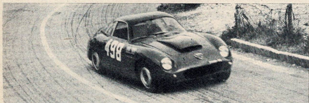
Florio, primo di classe sulla Flaminia Z.