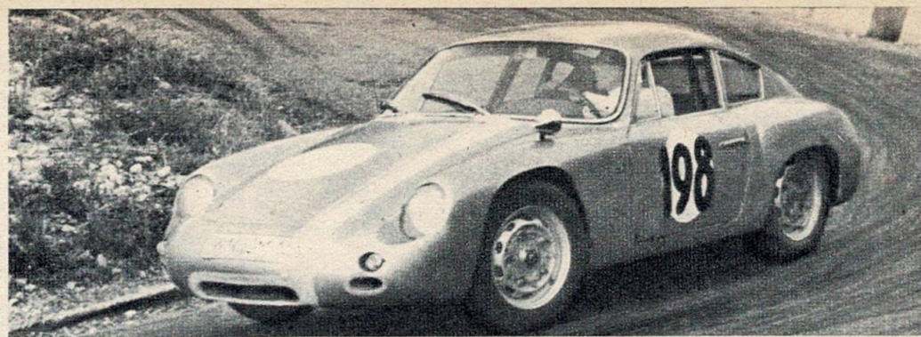
La Porsche Carrera di «Noris» verso il traguardo.