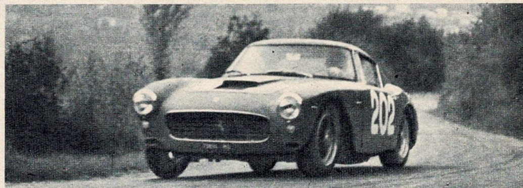
Egidio Nicolosi (su Ferrari 250 GT), secondo assoluto