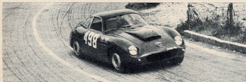
Florio, primo di classe sulla Flaminia Z.