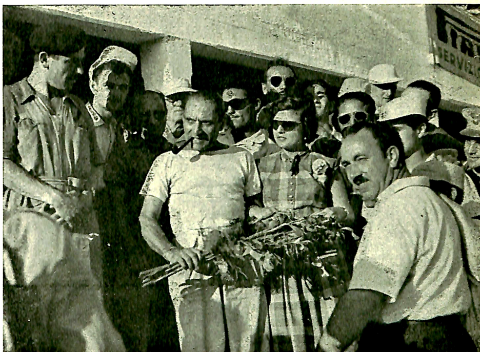
Felice Bonetto, ancora ansimante per lo sforzo sostenuto spingendo la vettura negli ultimi metri, ha già dimenticato la disavventura e, pipa fra i denti, e tradizionale mazzo di fiori in braccio si sottopone lietamente agli obiettivi dei fotografi mentre attorno a lui i tifosi siciliani lo festeggiano.

In questa Targa si è ripetuta per merito della Lancia , quello che era riuscito solo a Bugatti nel 1926. Allora i primi tre posti vennero conquistati, nell'ordine da Costantini, Minoia e