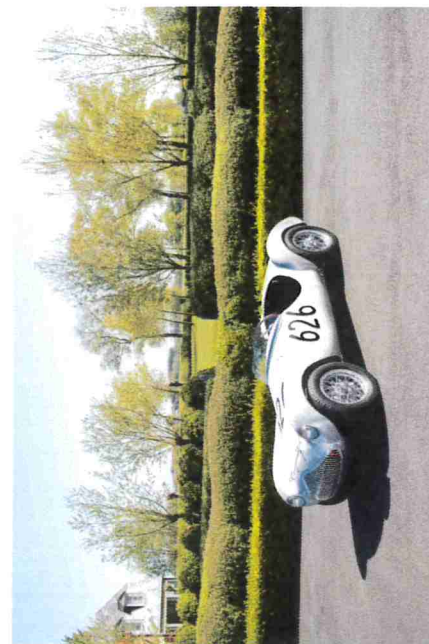
Photograph of vehicle in present form La photo du véhicule dans la forme présente

Remarks, modifications, history, etc. – see page 4. Remarques, modifications, histoire, etc. – voir page 4.