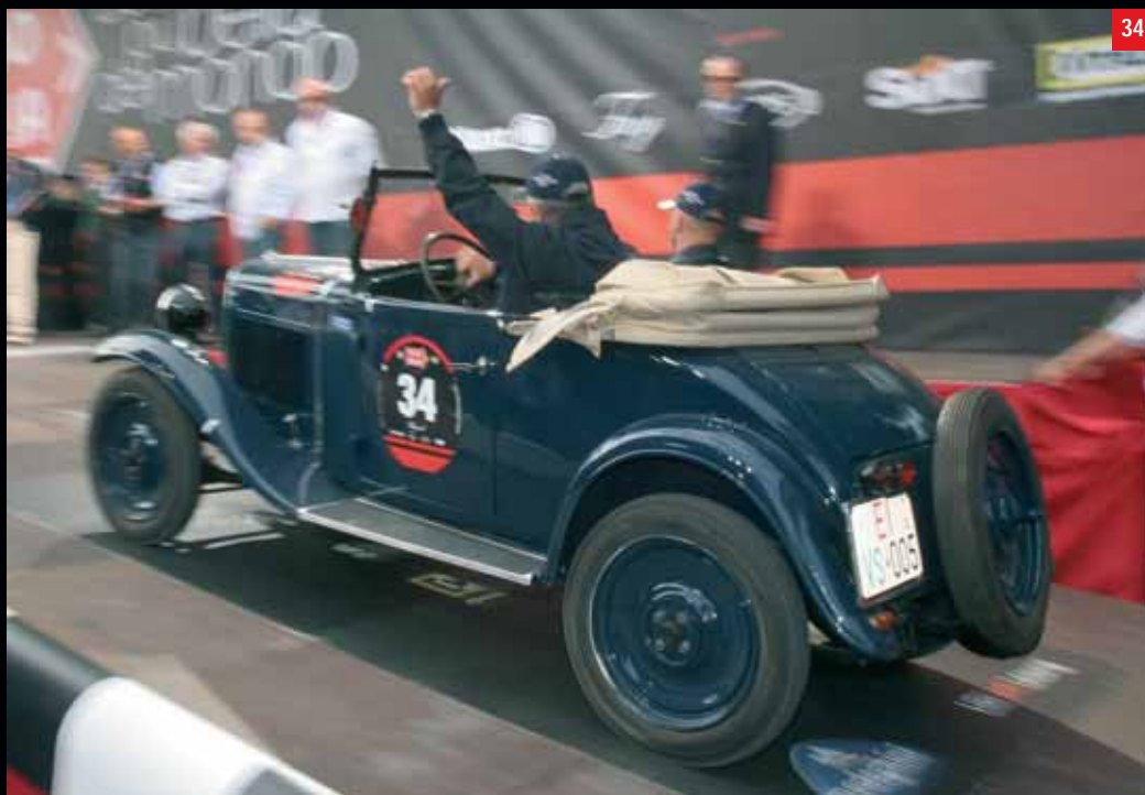
34 Matteace (I) Abbenante (I) FIAT 508 Balilla Spider 3M (1932)