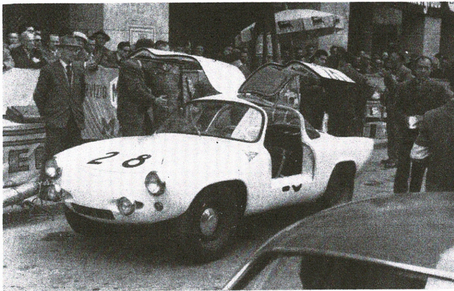
La soluzione Mercedes ha trovato degli imitatori. Alle verifiche della Mille Miglia si è presentata infatti questa originale vettura Renault «4 CV.» carrozzata alla Mercedes.