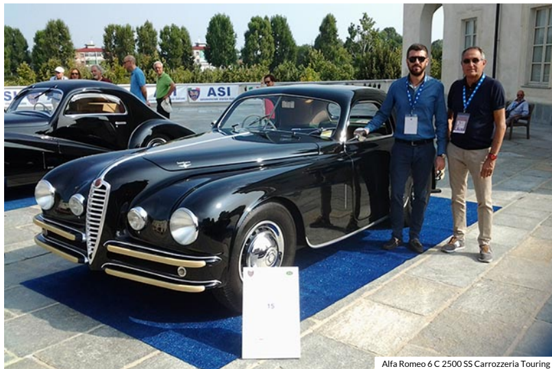
Alfa Romeo 6 C 2500 SS Carrozzeria Touring