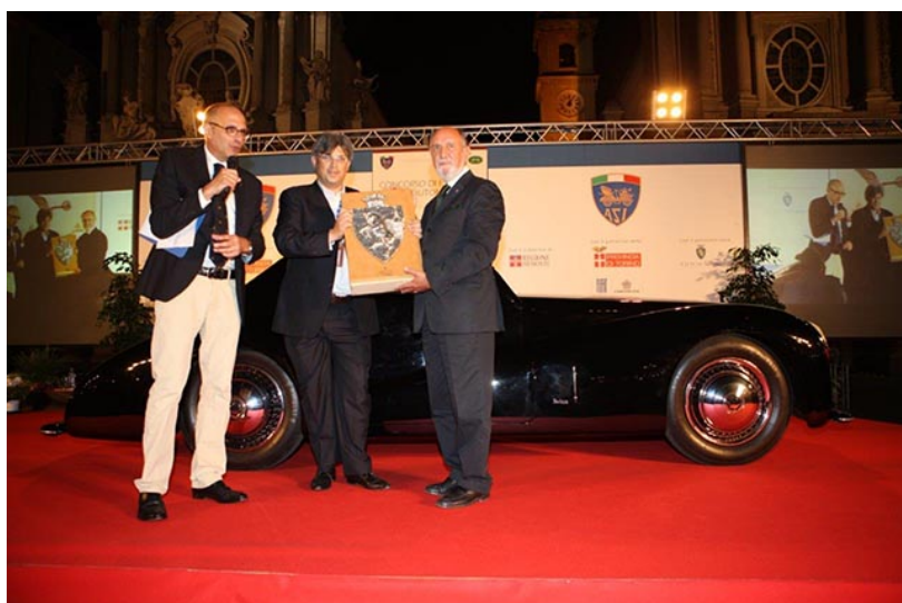
Alfa Romeo 6 C 2500 SS Carrozzeria Touring