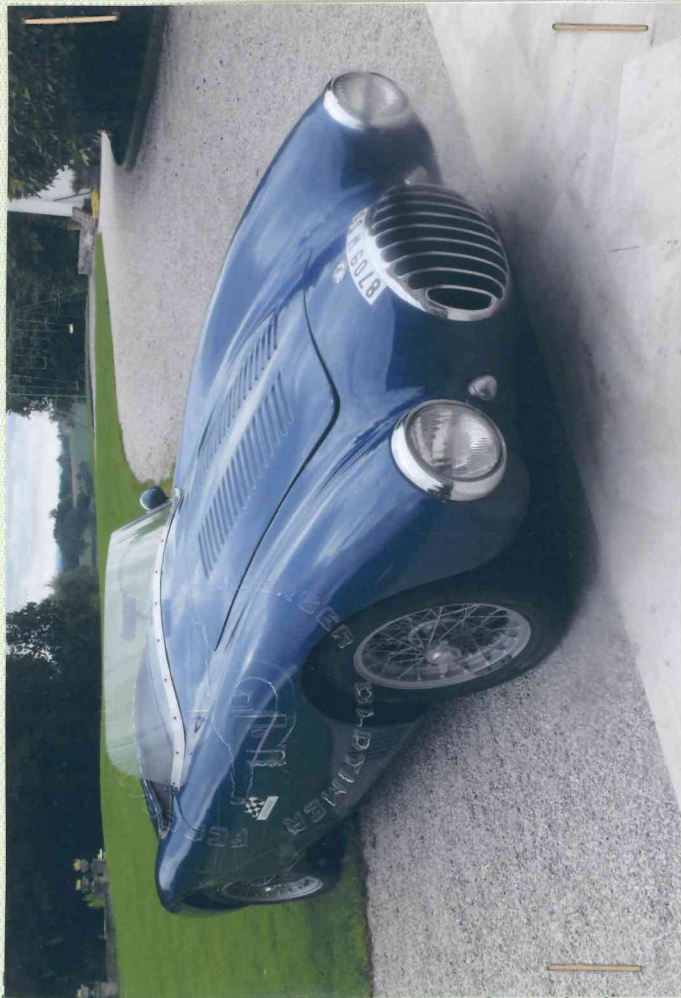
Le tampon doit déborder de la photo du véhicule dans sa forme présente.

Remarks, modifications, history, etc. - see page 4. Remarques, modifications, histoire, etc. - voir page 4.