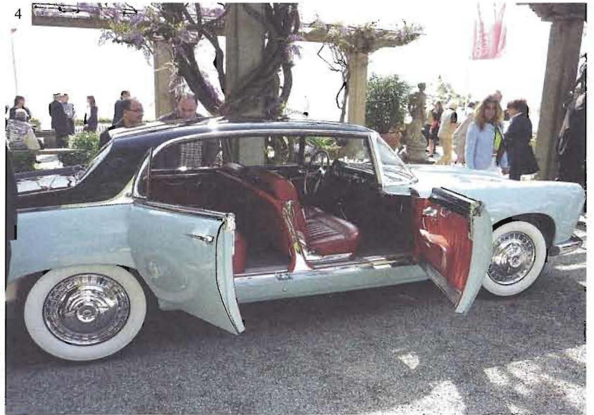
4 Lancia Florida by Pininfarina

23 RD -25 TH APRIL 2010 CONCORSO D'ELEGANZA VILLA D'ESTE