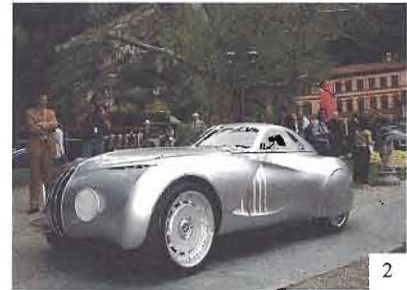
2 BMW Mille Miglia