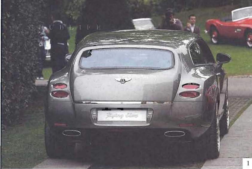
1 Bentley Flying Star by Touring