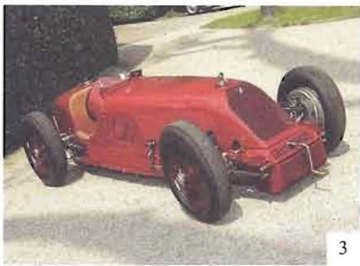
3 My personal favourite: Talbot-Darracq GP. 1926, 8 cylinder in line, 1500 ccm (I use my elbow to brake....)