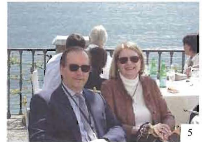
6 Wahl's & Joensson's