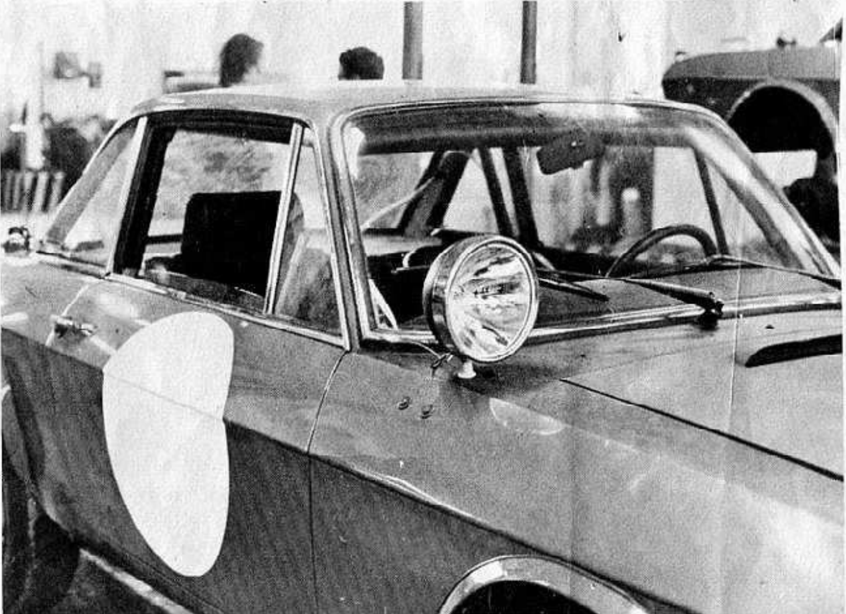
In queste tre foto (sopra e sotto), i particolari dei fari e delle speciali maniglie di sollevamento studiate apposta per... i negri gentili

Posteriormente oltre alle due maniglie sulla parte alta delle fiancate ormai classiche nei raid, notare l'esile paraurti in robusto tubo di acciaio che non ha la funzione di paraurti ma permetterà ai negri sbucanti da ogni parte e che si dice assistano con molto interesse alla corsa di aiutare l'equipaggio in caso di panne o di uscita di «pista» a rimettere la vettura in linea di marcia. Questa sbarra è adatta a sopportare tutto il peso del retrotreno della vettura, abbastanza leggero in verità, mentre la protezione anteriore ha quattro robusti punti di ancoraggio.