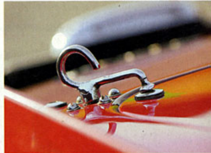
Der schnittige Barchetta-Aufbau glänzt mit liebevoll ausgeführten Details wie den filigranen Haubenschlössern