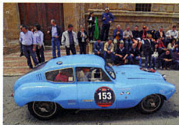
Auch das von Colli eingekleidete, hellblaue Crepaldi-Panhard Coupé nimmt heute noch regelmäßig an der „Mille Miglia Storica“ teil