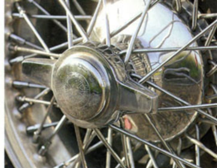
Verchromte Speichenräder sind natürlich Pflicht für einen rassigen Sportwagen aus Italien, selbst wenn es „nur“ ein 750er ist

nommen worden war, folgte 1967 das Aus für die Panhard-Pkw-Produktion – für einen der ältesten Autohersteller der Welt.