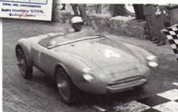
Einen Monat nach dem 1000-Meilen-Rennen holte sich Rigamonti den Klassensieg auf dem Rundkurs von Mugello