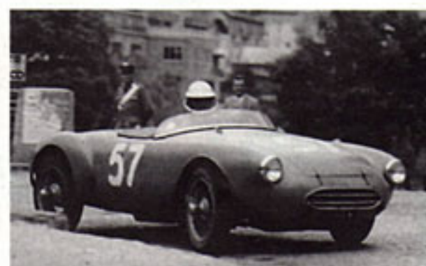
Dem Goldpokal der Dolomiten jagte der Italiener mit seinem kleinen Panhard Spider allerdings erfolglos hinterher (hier 1955)