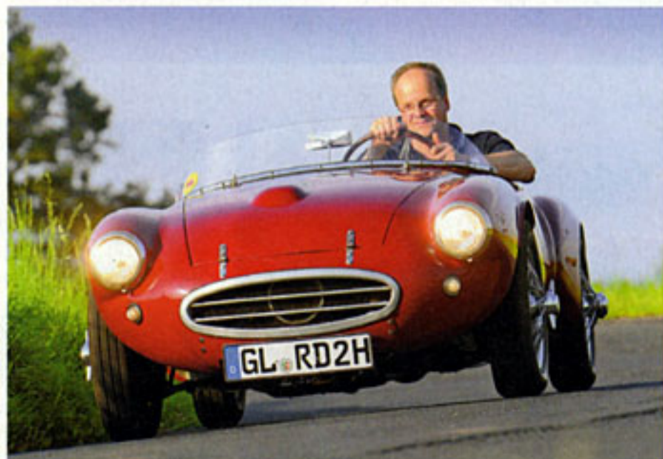
Von vorne ist deutlich zu erkennen, wie klein und kompakt das „Bötchen“ ist. Mit dem nur 400 Kilo leichten Wagen lässt sich auf ruhigen Landstraßen ganz nett rumtollen

Die unglaubliche Leistung des kleinen Flitzers und der damit verbundene Fahrspaß sind unnachahmlich. Der leistungsgesteigerte 750-Kubik-Motor kommt mit Weber-Doppelvergaser gut und gerne auf über 60 PS, für den Alltag haben wir es aber bei rund 50 PS belassen. Nicht viel, sagen Sie? Stimmt. Aber nicht für ein Alu-