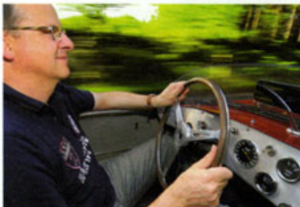
Italienische Momente: Zwei-Meter-Riesen hätten nicht viel Spaß an der typischen Froschhaltung hinterm Volant