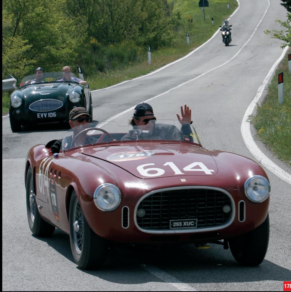
181 Van de Velde (NL) Van de Velde (NL) HEALEY Silverstone (1950)