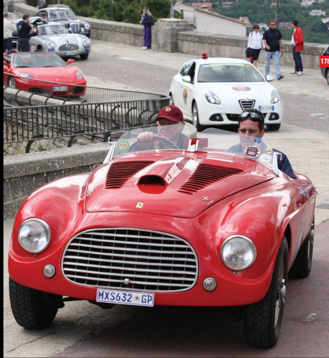
178 van Zyl (ZA) van Zyl (ZA) FERRARI 166MM (1950)