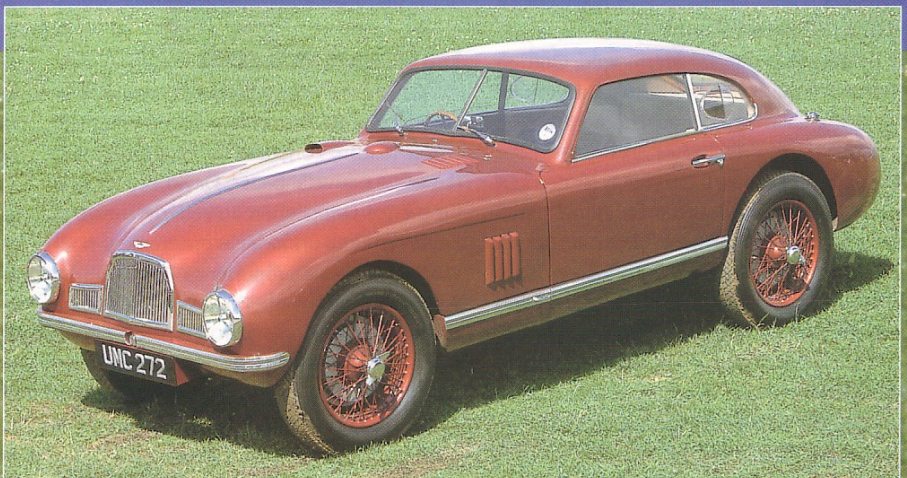
...et aujourd'hui, telle que nous l'avons retrouvée à Silverstone.