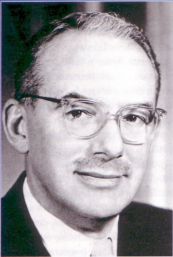
David Brown, un authentique passionné qui ne s'est jamais soucié de "rentabiliser" Aston Martin.