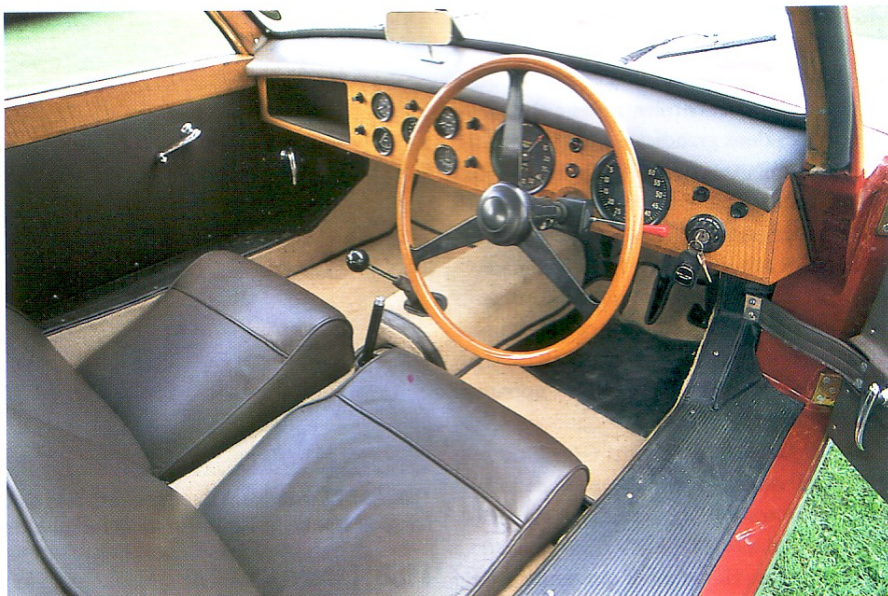
L'habitacle d'UMC 272 est demeuré très proche de celui des DB2 de série.

Sous le capot qui s'ouvre vers l'avant d'un seul tenant (avec les ailes), on découvre le moteur et la suspension indépendante. L'accessibilité mécanique est excellente. Le 6 cylindres 2580 cm 3 en fonte (alésage 78 mm, course 90 mm) est gavé par deux carburateurs SU H4 portant la puissance à 116 chevaux à 5000 t/mn. La modestie du taux de compression (7,5: 1) découle de la très mauvaise qualité du carburant au début des années 50. Faisant suite aux déboires d'UMC 66 au Mans 1949, sa soeur sera équipée d'un double circuit de refroidis-