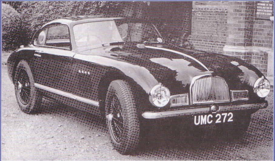
"UMC 272" photographée à l'époque où elle servait de "voiture de fonction" au patron...