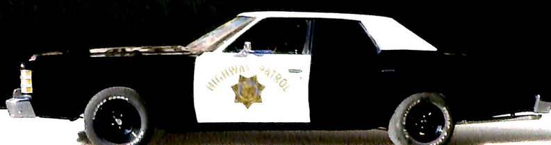
FORD LTD 1978: HIGHWAY PATROL