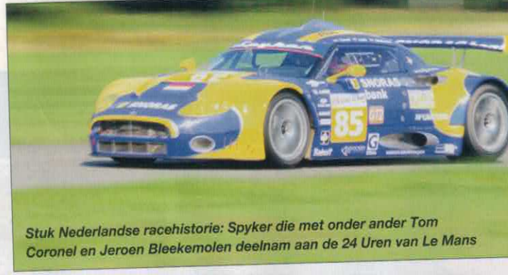
Stuk Nederlandse racehistorie: Spyker die met onder ander Tom Coronel en Jeroen Bleekemolen deelnam aan de 24 Uren van Le Mans

instructeur mee. Een kwestie van de theorie héél goed tot je nemen en dan Wroaaaap, het luchtruim kiezen. Eén foutje kan mens en machine fataal worden. De piloot die zijn kunstjes vertoonde kon goed overweg met deze unieke, historische en zeer kostbare machine. Dat gold ook voor de piloot die mocht laten zien waartoe een volledig gerestaureerde Mitchell B25 bommenwerper in staat is. Helaas, gevoelsmatig belaste hij de bejaarde machine zo te zien, ietsje teveel. Gelukkig waren de technici-op-de-grond het daarmee eens en er ook niet direct van gecharmeerd. Zo'n immense, tweemotorige machine is namelijk niet gebouwd om 'kunstjes' mee te doen... Vervolgens nog een optreden van de Fokker Four en nog wat oudtijds materiaal. Het talrijke publiek genoot van dit alles. En gelukkig vloog men niet over het publiek heen, want de laatste tijd zijn er wel wat van die kisten voortijdig op aarde gekomen ten koste van veel gewonden en een aantal doden. Safety First loopt ook als een rode draad door dit deel van het evenement. Op de grond draaide de cateraar op volle toeren. De vracht- en bestelwagens reden af en aan. Het was behoorlijk warm en dan kun je de boel met beperkte middelen niet op de juiste temperatuur houden... Tot zover Chapeau voor de tot Ridder geslagen Henk Janus en zijn mannen, het vliegbasis 'personeel'. Helemaal top, geen moment verveeld.