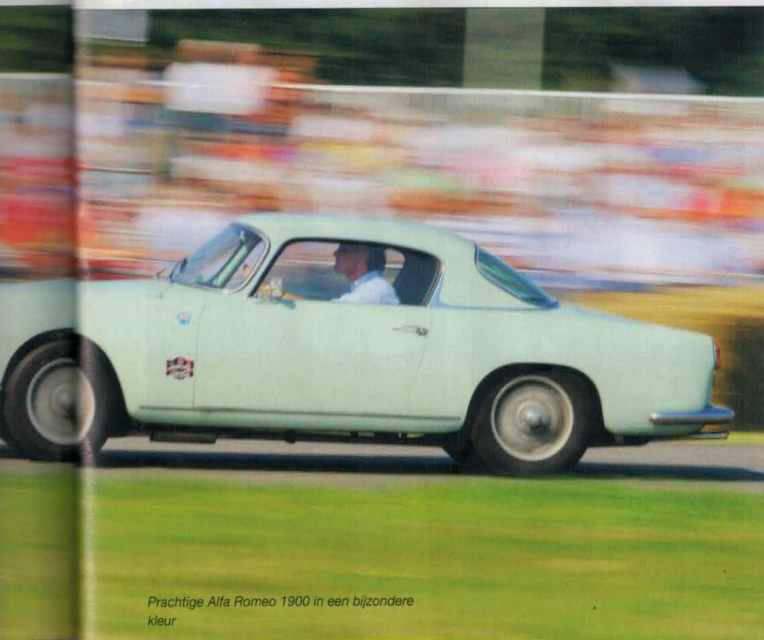
Prachtige Alfa Romeo 1900 in een bijzondere kleur