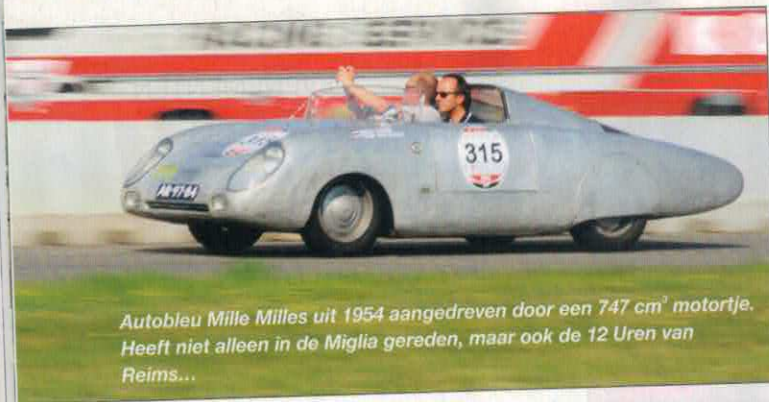
Autobleu Mille Miglia uit 1954 aangedreven door een 747 cm 3 motortje. Heeft niet alleen in de Miglia gereden, maar ook de 12 Uren van Reims...