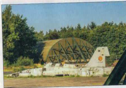
Een beetje rondschuïmend op het terrein werd aan de rand van wat bossage dit restant van een NF5 ontdekt. De 'kist' is indertijd vroegtijdig bij Best aan de grond gekomen. Zal - volgens verkregen informatie - opgesteld worden in een nieuw te openen museum...

Met Henri Pescarolo en Matra op zo'n dag in de hoofdrol , kan Matra als club natuurlijk niet ontbreken. Welnu, ook de clubleden hadden massaal gereageerd op de uitnodiging en met liefde hun 125 euro afgetikt. Een respectabel aantal Bagheera's en nog veel meer Murena's, maar vooral de