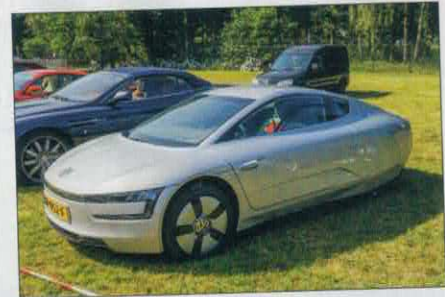
Ook op de parkeerplaatsen zijn heel bijzondere auto's te vinden. Wat dacht u van deze Volkswagen?

oudere en meer tot de verbeelding sprekende modellen trokken de aandacht. Wij hebben het dan over het uitzonderlijk slank gellijnde type Djet en de minder mooie type 530 voorzien van zo'n astmatisch rochelend Ford Taunus V4-motortje. Het geheel werd aangevuld met een veldje Dax, Ram, Pilgrim en zo 'Cobra's'. Beetje vreemde mix, maar gezien het ruime deelnemersaanbod van die dag noodzaak om dat te mixen... Een gemengd gezelschap werd ook het volgende optreden. De Historic GT/GP Cars gebouwd tussen 1928 en 1960. Om helemaal blij van te worden, Dick van Amsterdam - ook eens voorzitter van de HARC - had zijn Lister Jaguar weer bij zich. Laten wij voorzichtig zijn, een jaar of dertig geleden kroepoekte hij de machine tijdens een verkeerd uitstapje gedurende een toenmalige Historic Zandvoort Trophy... Gelukkig is de Lister nu weer raceklaar hoewel er nog wat 'fijntuning' plaats moet vinden. Tenslotte kon het steeds enthousiastere publiek nog getraceerd worden op een mager, maar daardoor niet minder interessant veldje Historische Monoposti. Opnieuw kwam Henri Pescarolo in actie. Deze reis