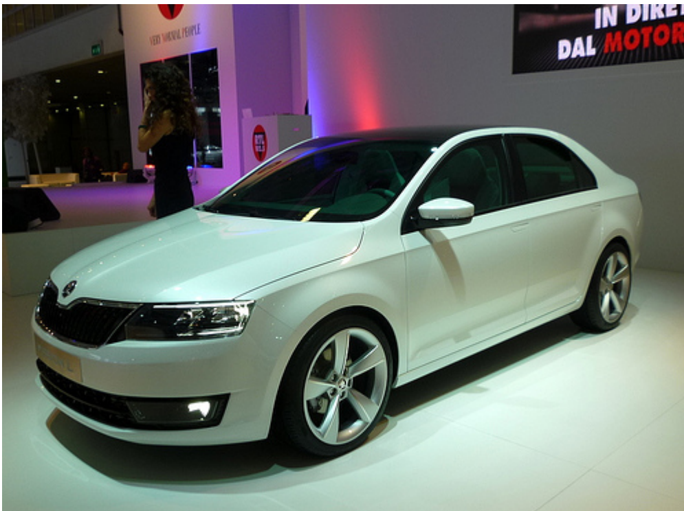
La Skoda Vision L anticipa l'aspetto della prossima nuova autovettura appartenente al segmento C