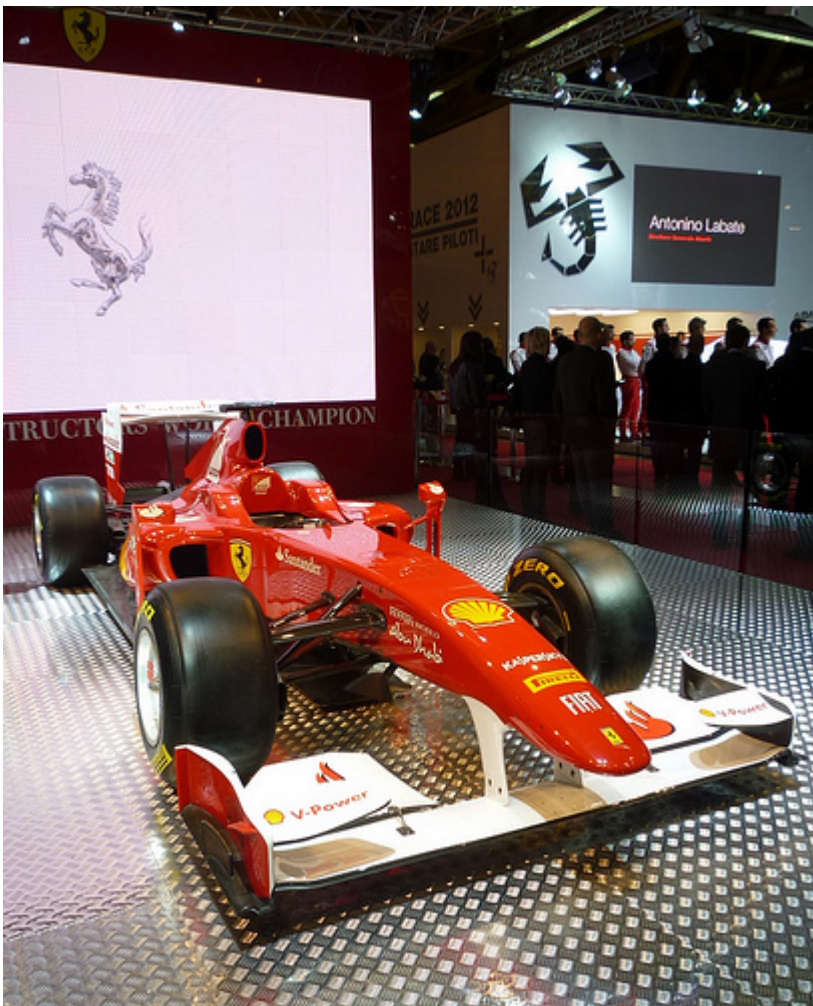
La Ferrari F10 del 2010 era esposta tra un bel numero di altre auto Ferrari negli allestimenti da pista e da strada