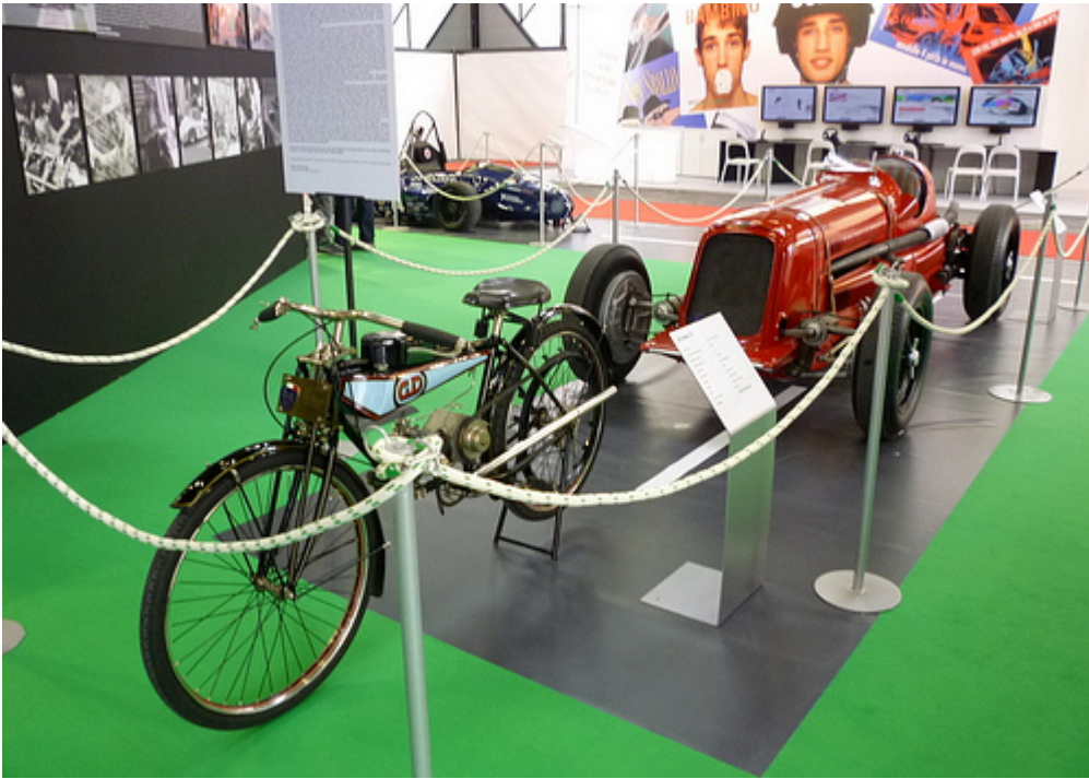
La motocicletta GD Stella 2T del 1923 e la Maserati 6C Grand Prix del 1934