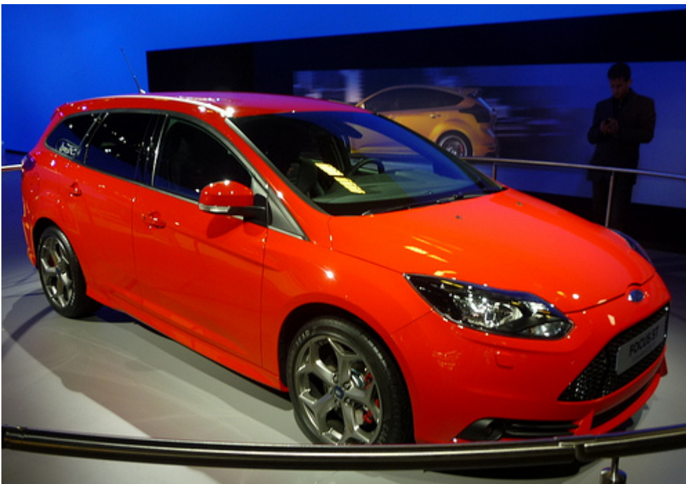
La Ford Focus ST Station Wagon adotta un motore turbocompresso con una cilindrata di 2 litri, sviluppante una potenza di 250 cavalli. L'assetto, i freni e l'allestimento sono stati adeguati