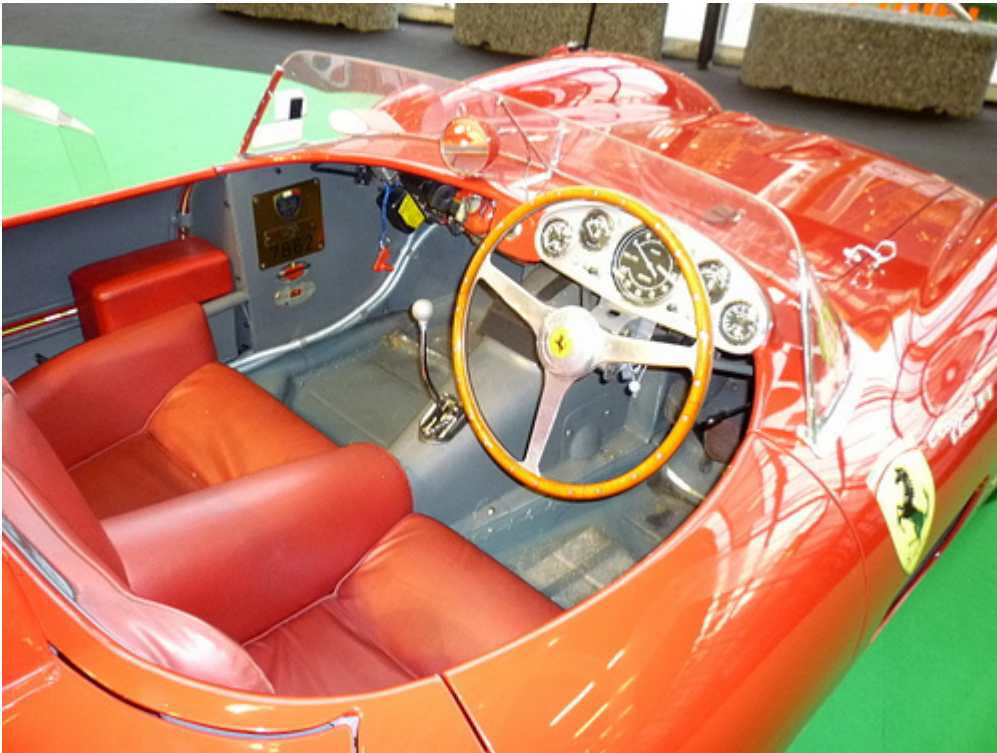
Il posto di guida della Ferrari 500 TRC del 1957 che rappresenta una delle auto da competizione più ricercate