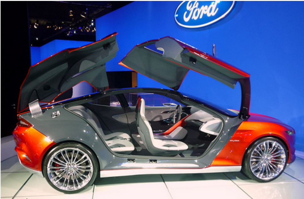
La Ford Evos é una concept car che anticipa le future evoluzioni dello stile della auto della Ford