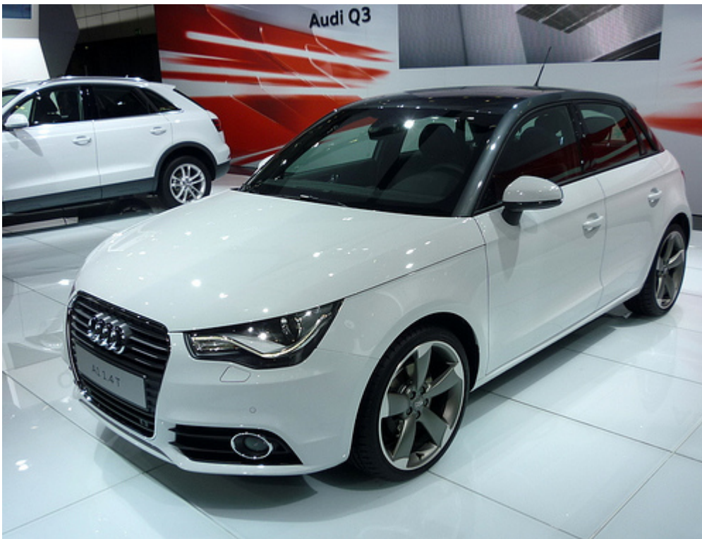
L'Audi A1 Sportback con le cinque porte permette un utilizzo più agevole, senza appesantire la linea della piccola di casa Audi