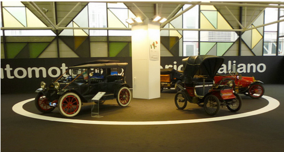
In primo piano da sinistra la Hupmobile del 1914 e la De Dion Bouton del 1899