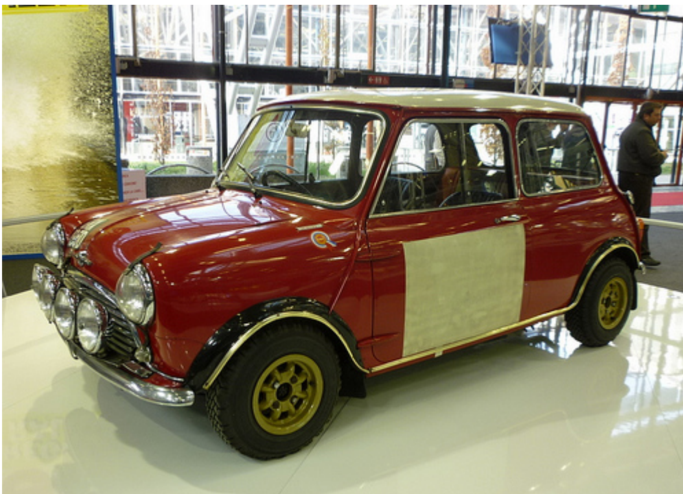
La Morris Mini Cooper S del 1966 che é stata una grande protagonista dei Rally più famosi dell'epoca