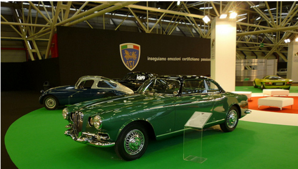
In primo piano la Lancia Aurelia B52 carrozzata da Vignale nel 1952 ed in secondo piano la Fiat 1100 Ala Doro del 1947 , due bei esempi di auto sportive italiane.