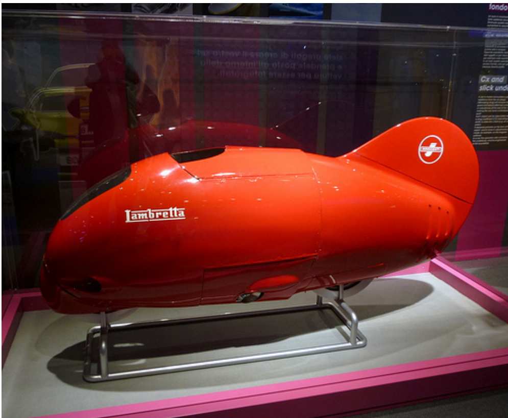
La Lambretta da record che nel 1952 raggiunse la velocità di ben 201 km/h spinta da un motore di soli 125cc. Era nello spazio espositivo del Museo della Scienza e della Tecnologia di Milano