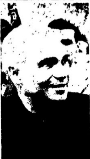
TARUFFI il vincitore del Giro di Sicilia