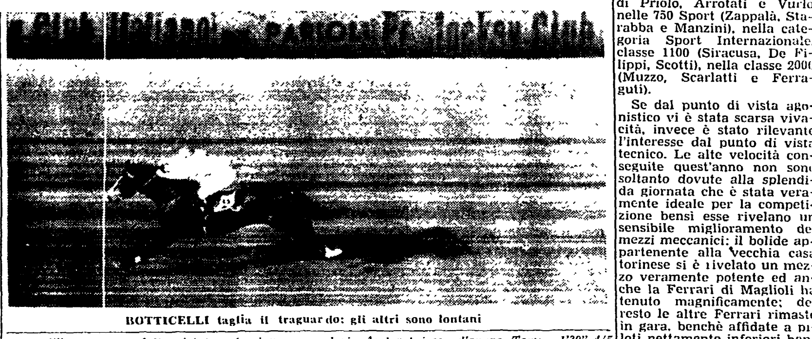
BOTTICELLI taglia il traguardo; gli altri sono lontani

Fastigio termina al secondo posto L'ippica italiana ha ieri vissuto una delle sue più grandi giornate alle Capannelle, dove si è disputato il premio Parioli. (ribattezzato quest'anno con scuro successo Jockey Club, una giornata cui non è mancato veramente nulla per entrare nel ricordo di tutti i fan del cavallo. Da oggi Napoli ha un nuovo idolo: Fausto Coppi, il campione che quando si scatena riduce le corse ad un gioco, con il quale gioca e si diverte.