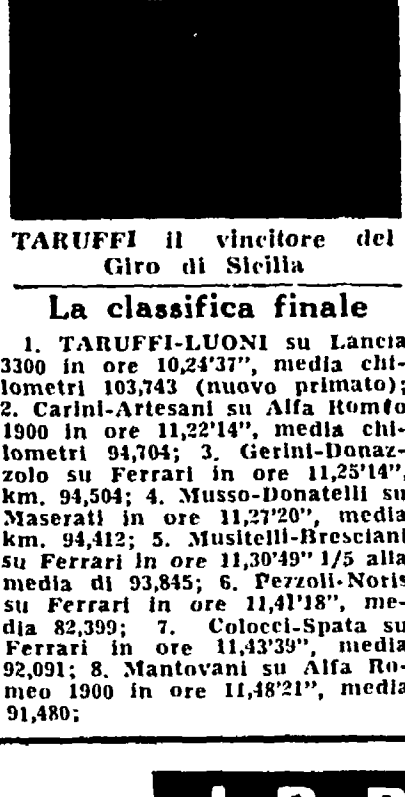
TARUFFI il vincitore del Giro di Sicilia

La Ferrari di Maglioli fermata da un incidente, mentre si trovava in testa - Migliorato il record della corsa alla media di km. 103,743