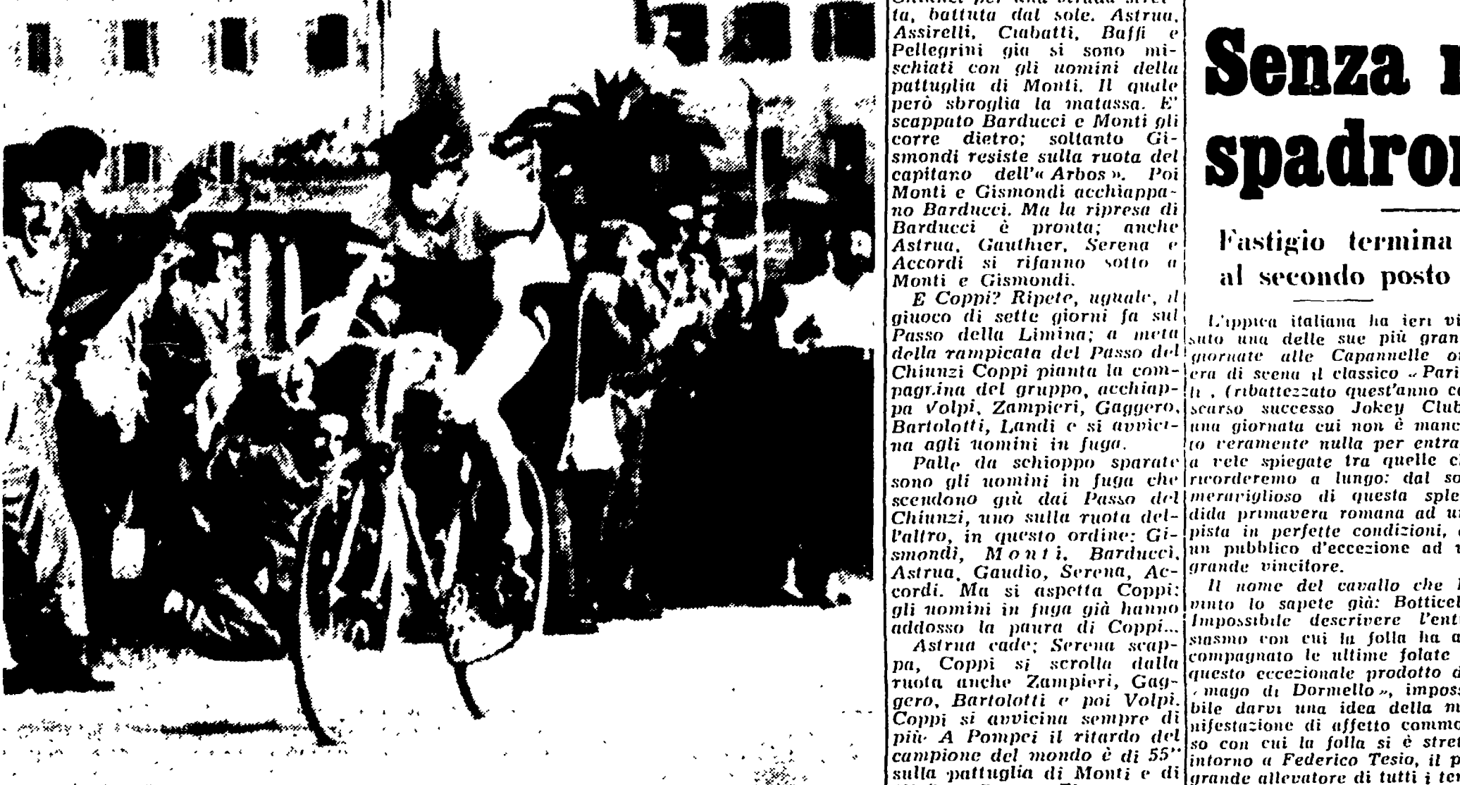
GIRO DELLA CAMPANIA: Il vittorioso arrivo di Coppi sulla pista dell'Arenocchia di Napoli

Fastigio termina al secondo posto L'ippica italiana ha ieri vissuto una delle sue più grandi giornate alle Capannelle, dove si è disputato il premio Parioli. (ribattezzato quest'anno con scuro successo Jockey Club, una giornata cui non è mancato veramente nulla per entrare nel ricordo di tutti i fan del cavallo. Da oggi Napoli ha un nuovo idolo: Fausto Coppi, il campione che quando si scatena riduce le corse ad un gioco, con il quale gioca e si diverte.