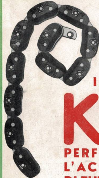
Cinghia trapezoidale originale "BURKE"