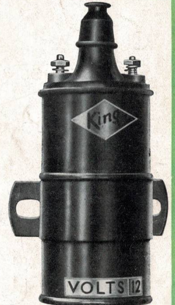
Bobina d'accensione originale "KING"