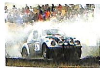
Großes Spektakel: Wasserdurchfahrt auf der Buisen-Special-Stage

Parade von Pikes-Peak Autos, die aber nur bei der Prüfung Hilgerath am Freitagabend (24.) in Aktion zu erleben sind. Am Samstag gehören die spektakulären Autos, die einst beim US-Bergrennen aufgesetzt wurden, zu den Exponaten der Rallye-Meile in Daun. Unter den Startern des Festivals ist natürlich auch der zweifache Rallye-Weltmeister Walter Röhrl, der als Schirmherr des Festivals fungiert. www.eifel-rallye-festival.de