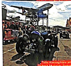
Tolle Atmosphäre am Technik Museum Speyer