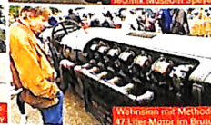
Wahrnehm mit Methode: 47-Liter-Motor im Brutus