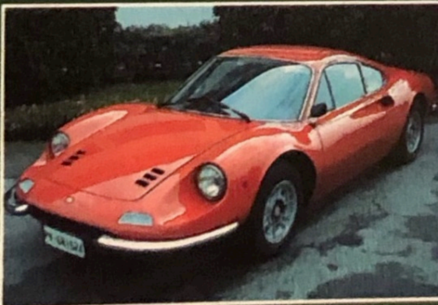
Ferrari Dino 246 GT, 1971, condizioni impeccabili