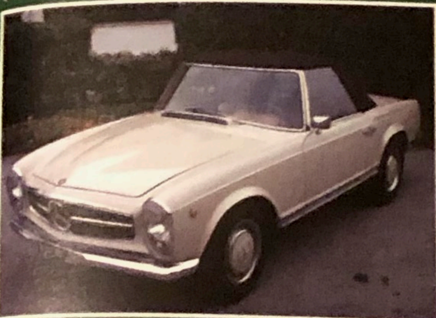
Mercedes 280 SL, 1968, originale, perfette condizioni