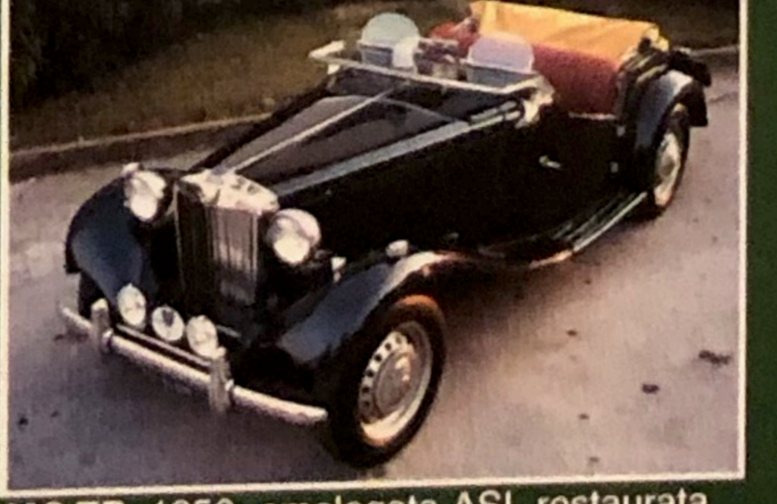
MG TD, 1950, omologata ASI, restaurata perfetta, altri modelli serie T disponibili