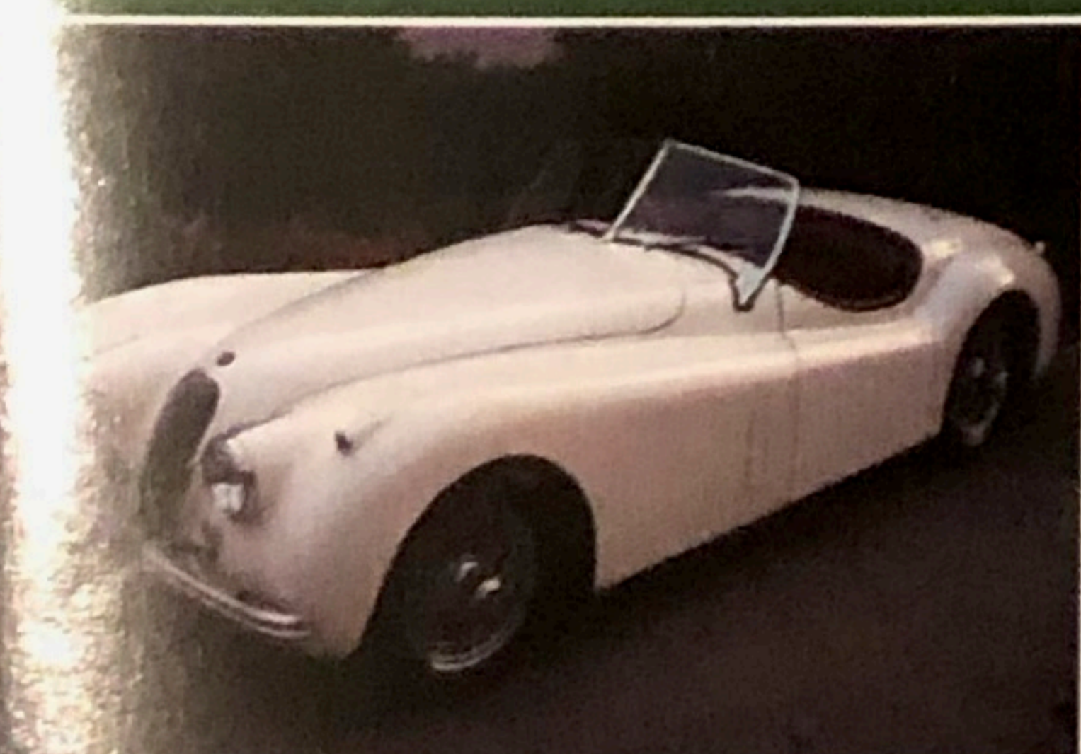
Jaguar XK 120 Roadster, omologata ASI, perfetta