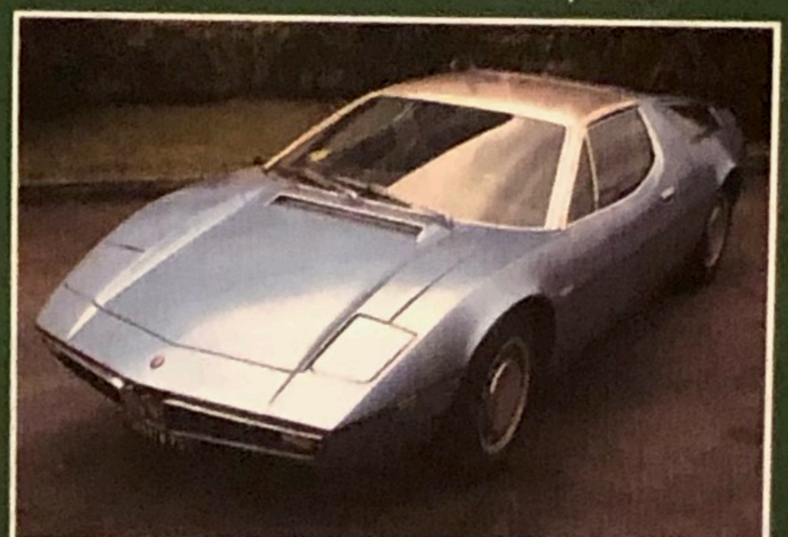
Maserati Bora, 1973, uniproprietario, targhe e documenti dell'epoca, perfetta