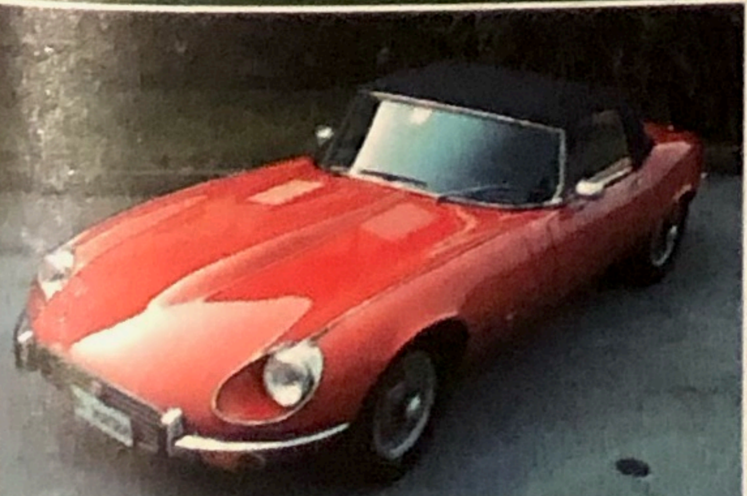
Jaguar E-Type Roadster, vari modelli disponibili