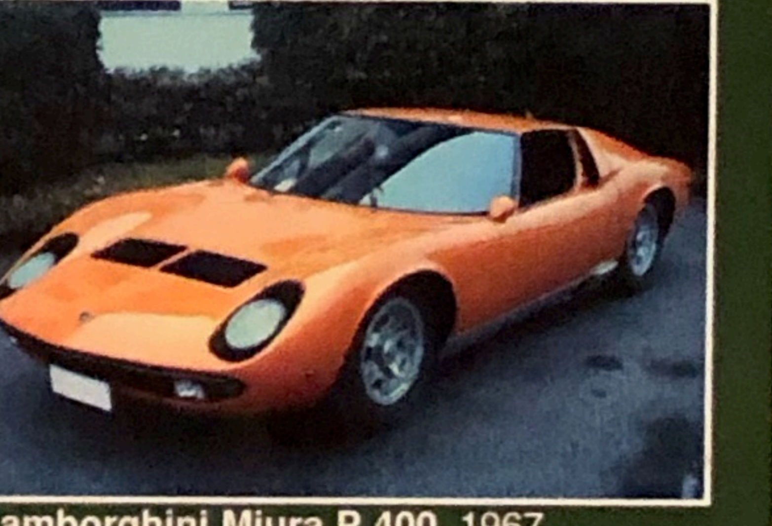
Lamborghini Miura P 400, 1967, omologata ASI, restaurata