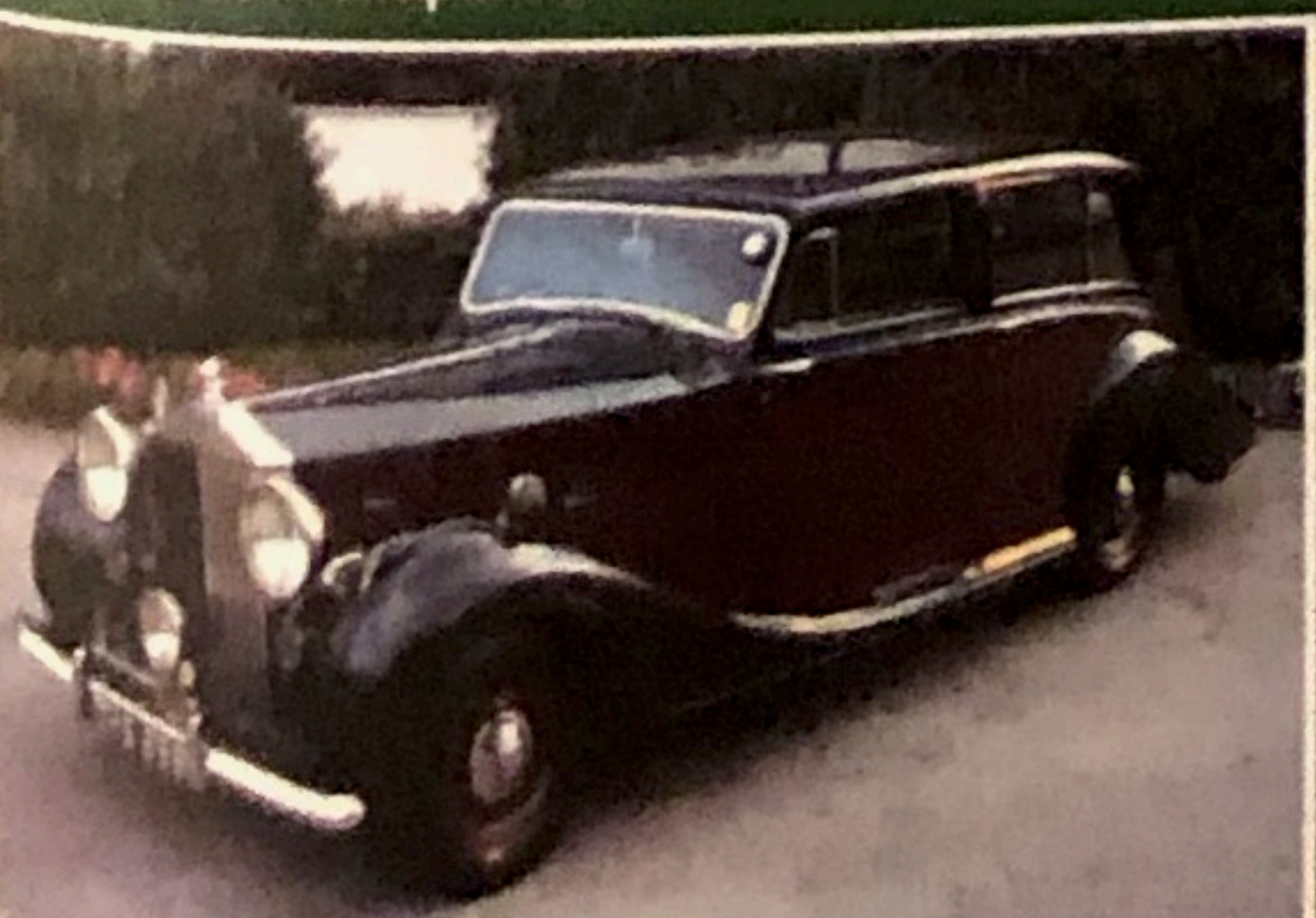
Rolls Royce Silver Wraith, 1948, omologata ASI