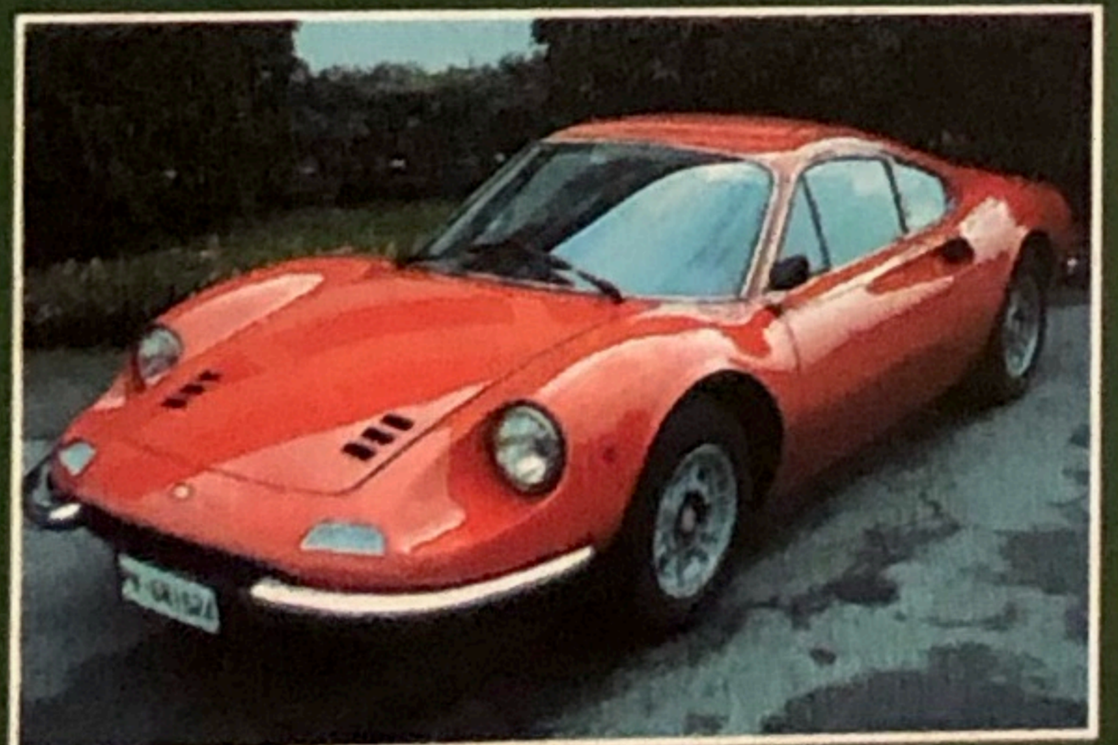
Ferrari Dino 246 GT, 1971, condizioni impeccabili