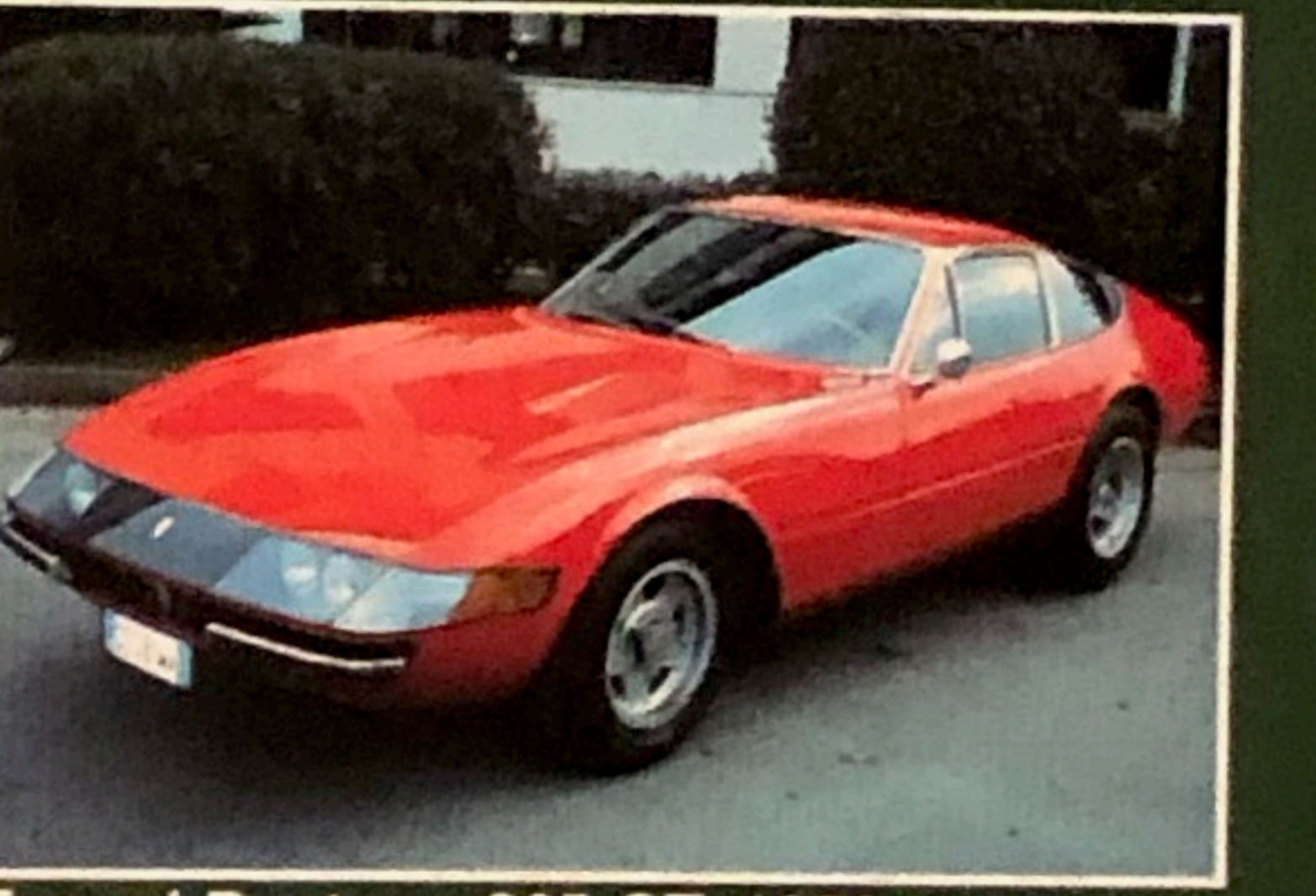
Ferrari Daytona 365 GT, 1970, restauro ai massimi livelli, pari al nuovo