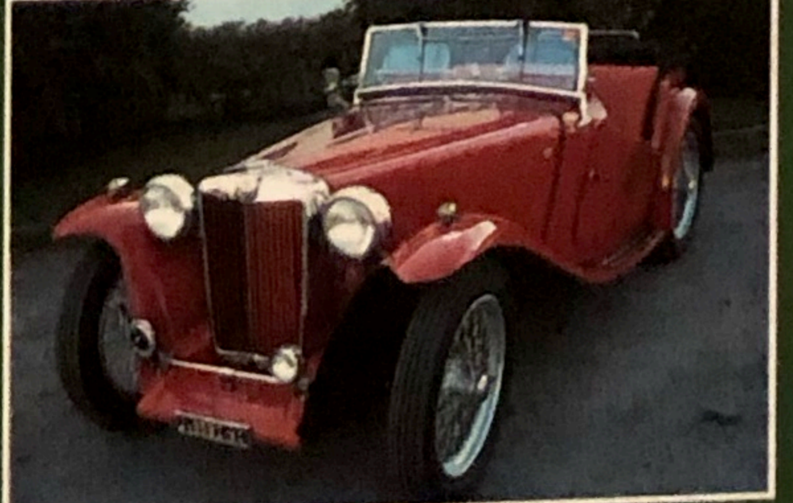
MG TC, 1947, omologata ASI, restaurata perfetta, altri modelli serie T disponibili