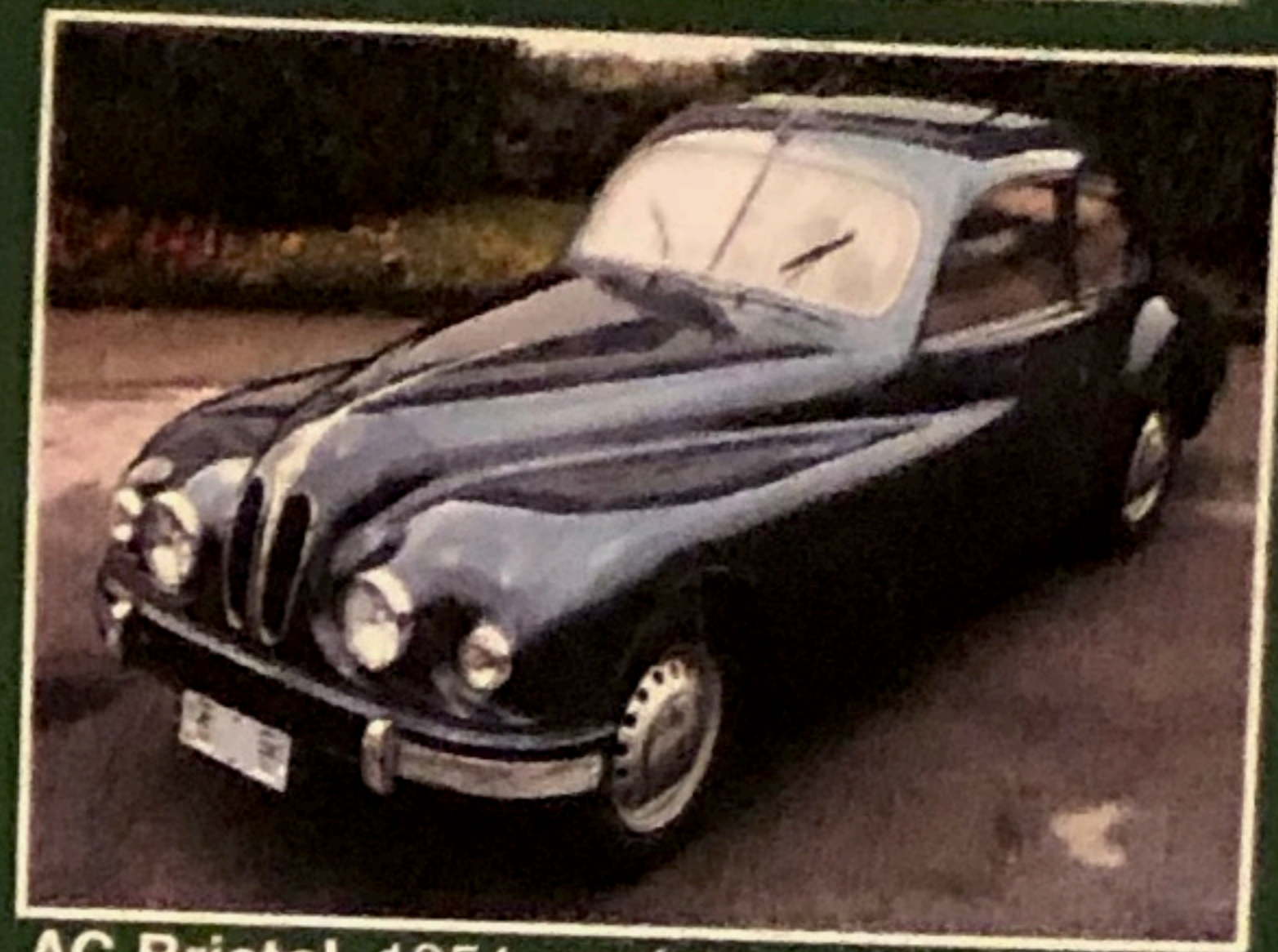
AC Bristol, 1951, perfettamente conservato, meccanica BMW 328 perfetta