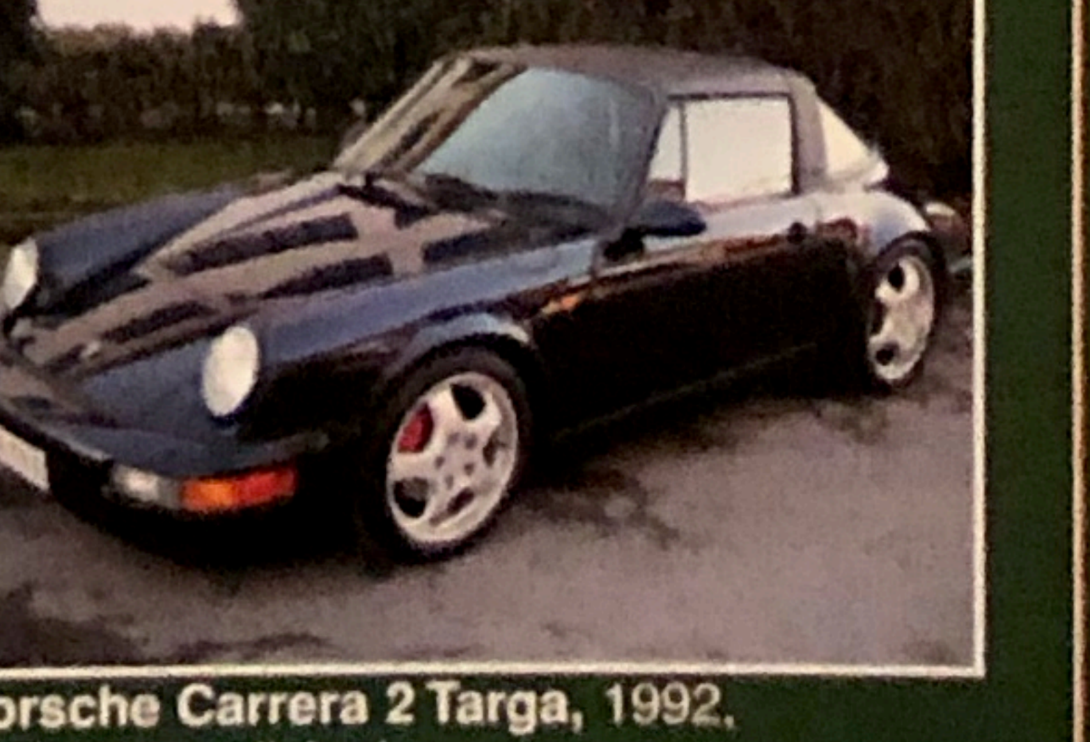
Porsche Carrera 2 Targa, 1992, perfette condizioni

Web site: www.luzzago.com E-mail: info@luzzago.com sabato pomeriggio si riceve solo su appuntamento