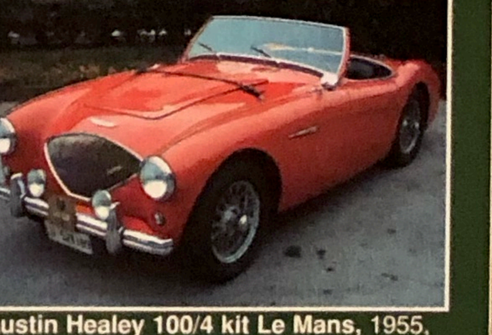
Austin Healey 100/4 kit Le Mans, 1955, omologata ASI, perfetta