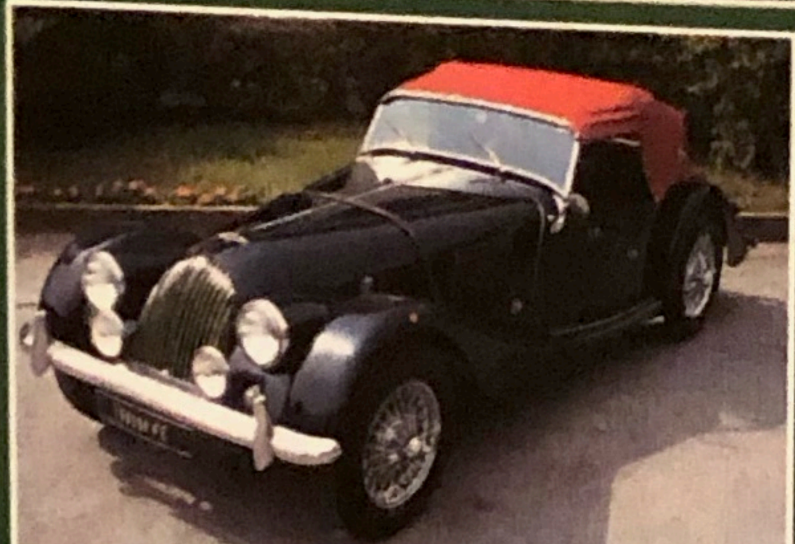
Morgan 4/4 1.6, 1960, targhe nere, accessoriata, perfetta, altri esemplari disponibili