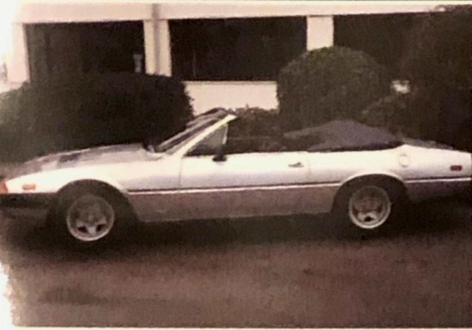
Ferrari 400 cabrio, 1978