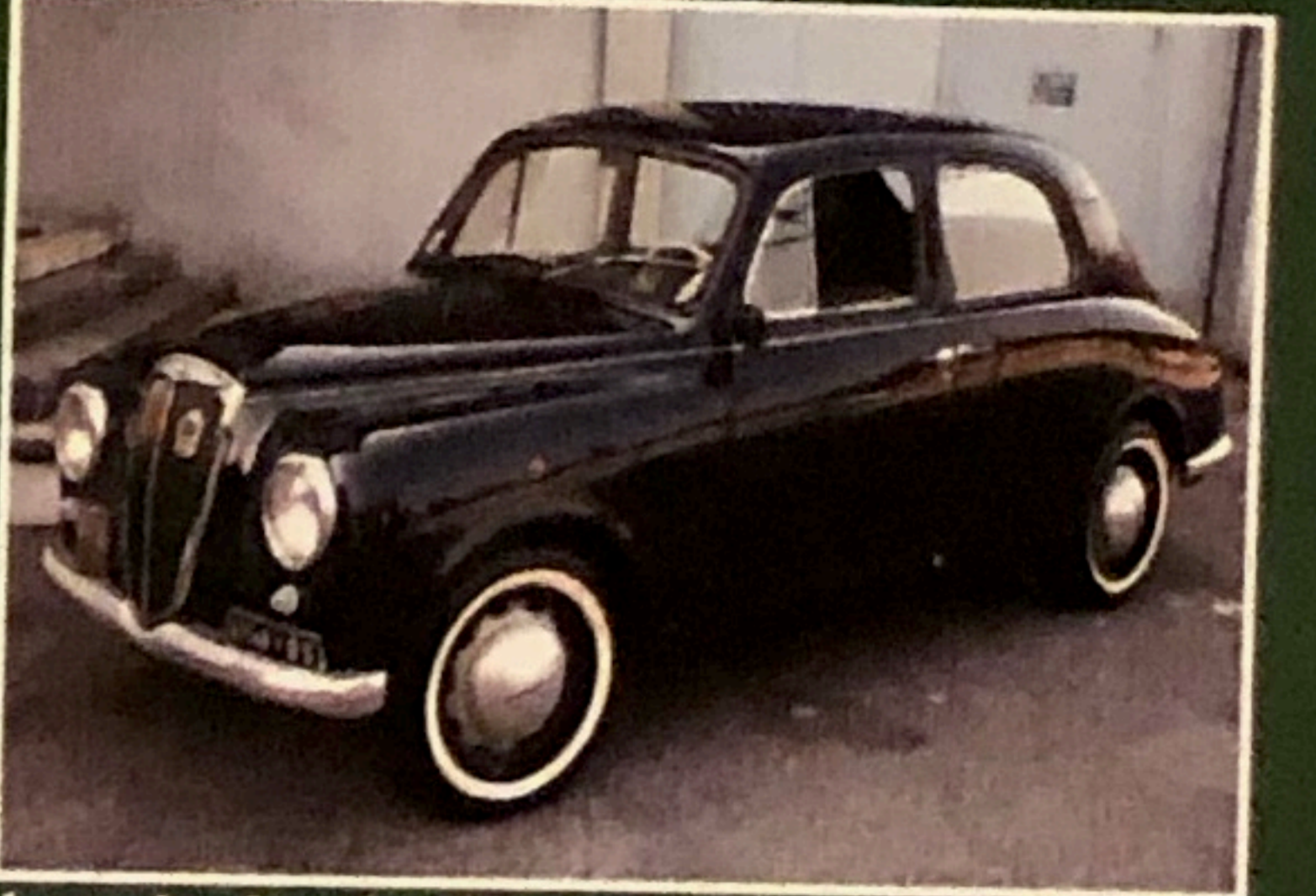
Lancia Appia 1S, 1953, omologata ASI