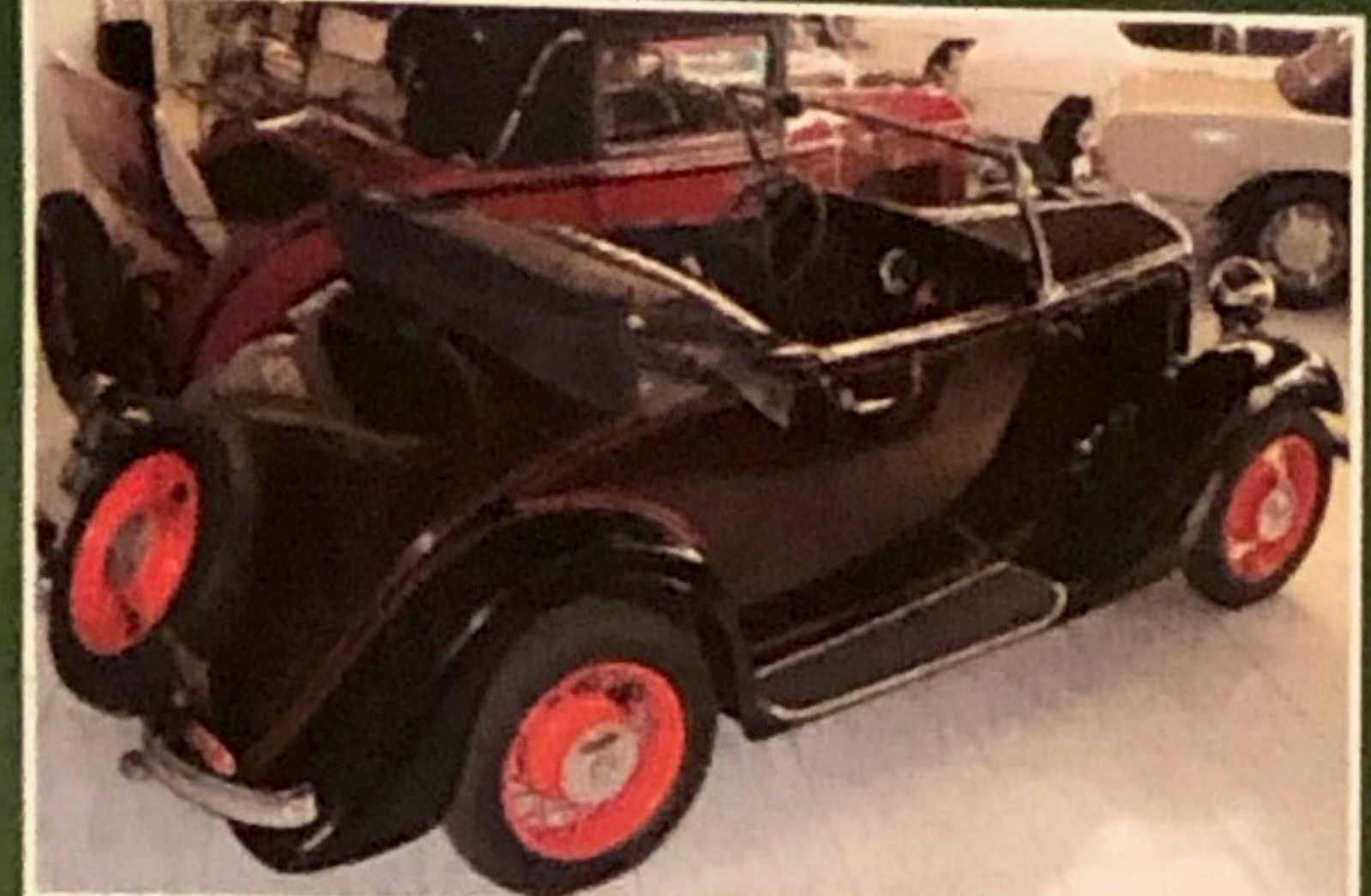
Fiat Balilla Spider, 1934, omol. ASI, uniproprietario, targhe e documenti originali