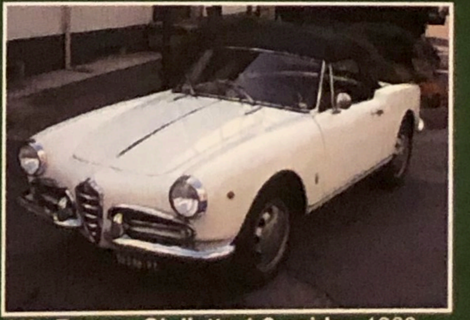
Alfa Romeo Giulietta 1.3 spider, 1960, omologata ASI, targhe, documenti originali