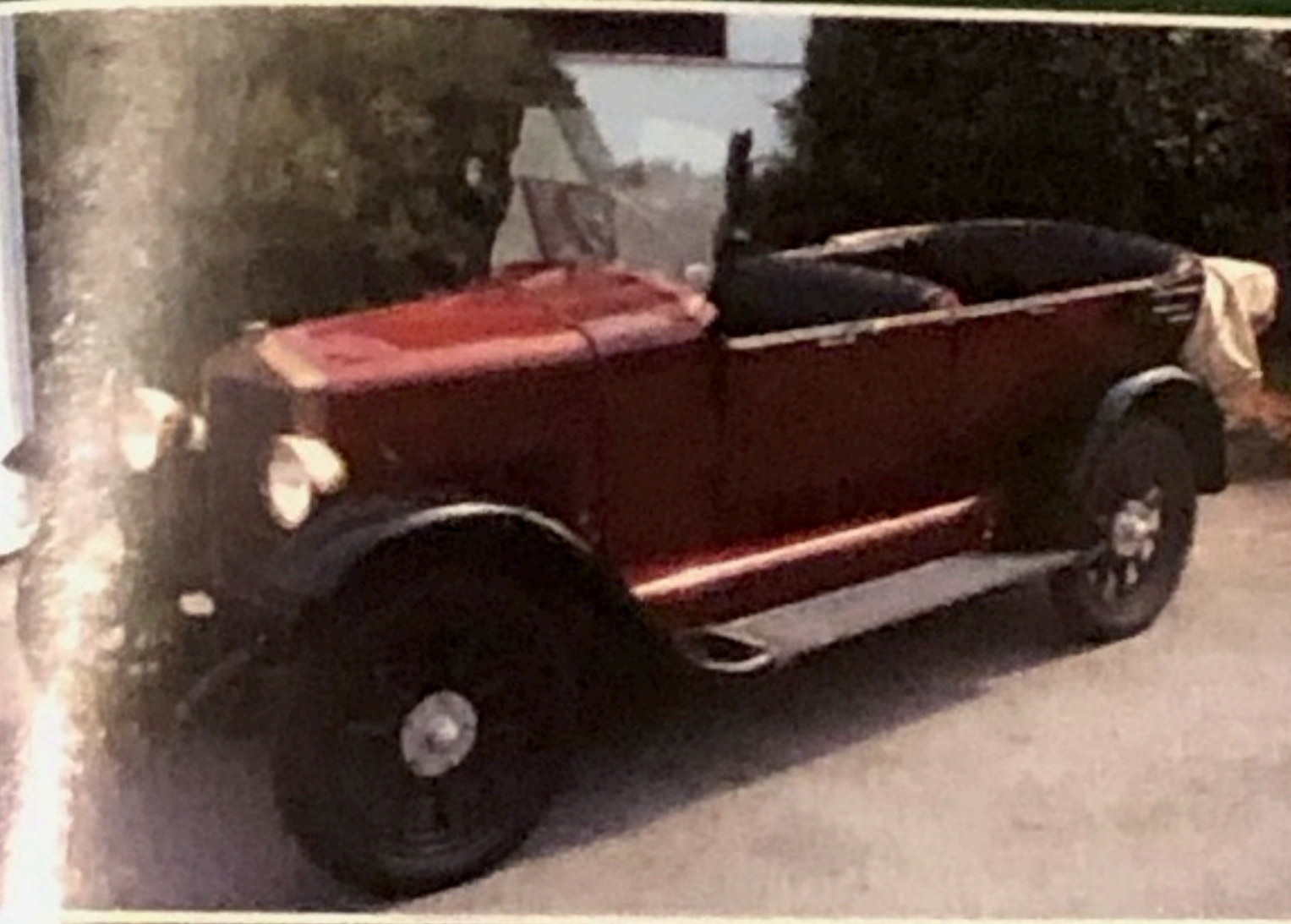
Lancia Aurea, 1923, 1500 cc