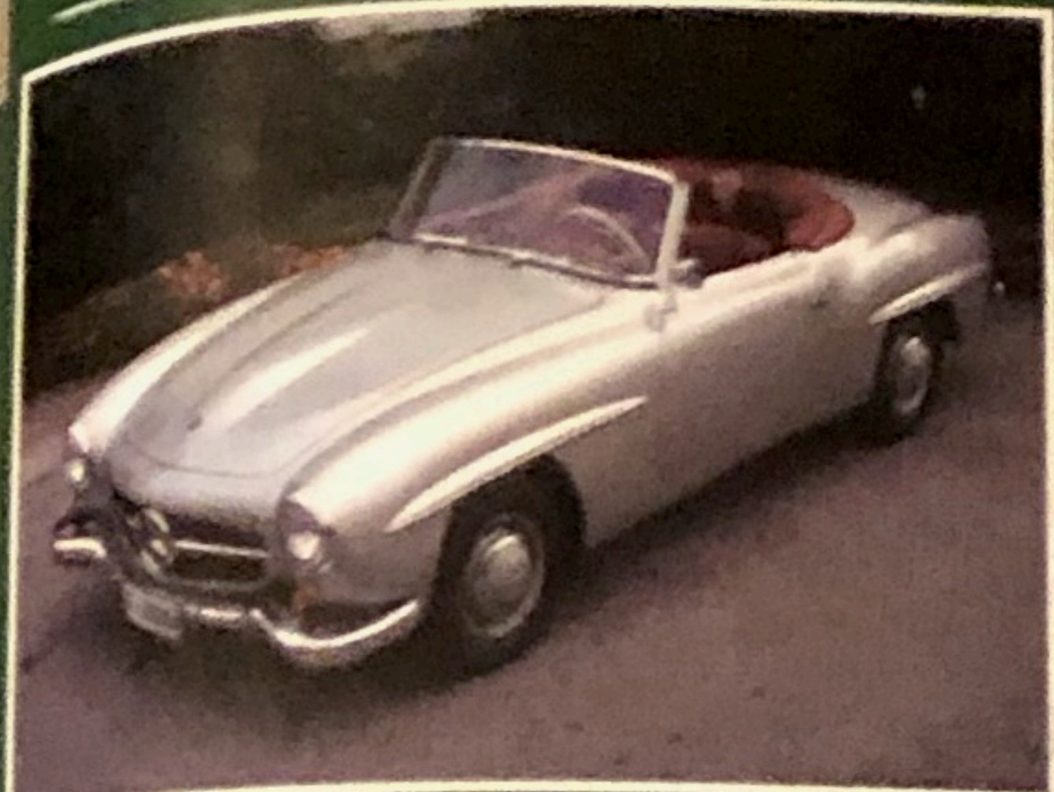
Mercedes 190 SL, 1950, omologata ASI, perfetta, vari esemplari disponibili

SPECIALISTI AUTO CLASSICHE E GRANTURISMO VIA MANDOLOSSA, 65 RONCADELLE - BRESCIA Tel. 030/2411531 (5 linee r.a.) Fax 030/2411540 www.luzzago.com - luzzago@libero.it