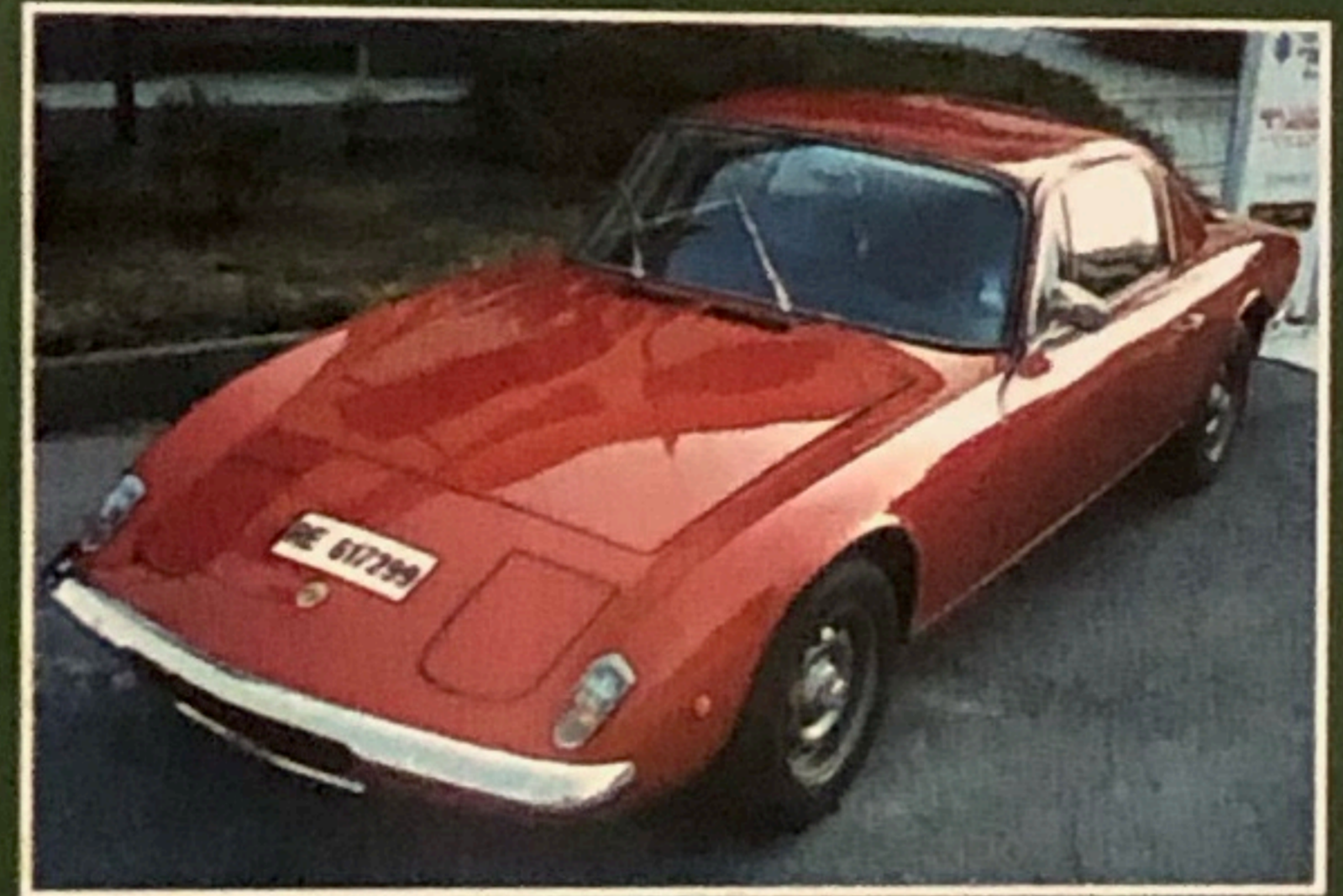
Lotus Elan Plus 2, 1968, omologata ASI, perfetta