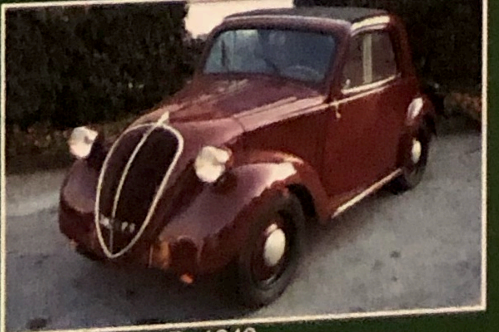
Fiat Topolino B, 1949, completamente restaurata