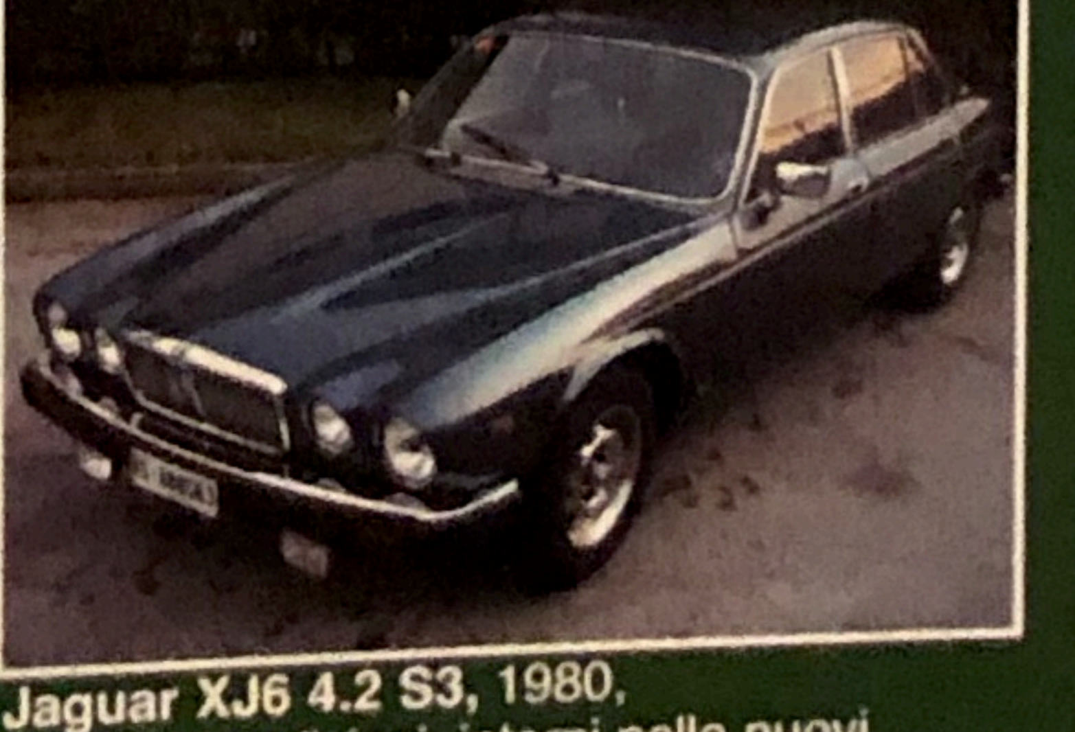
Jaguar XJ6 4.2 S3, 1980, perfette condizioni, interni pelle nuovi