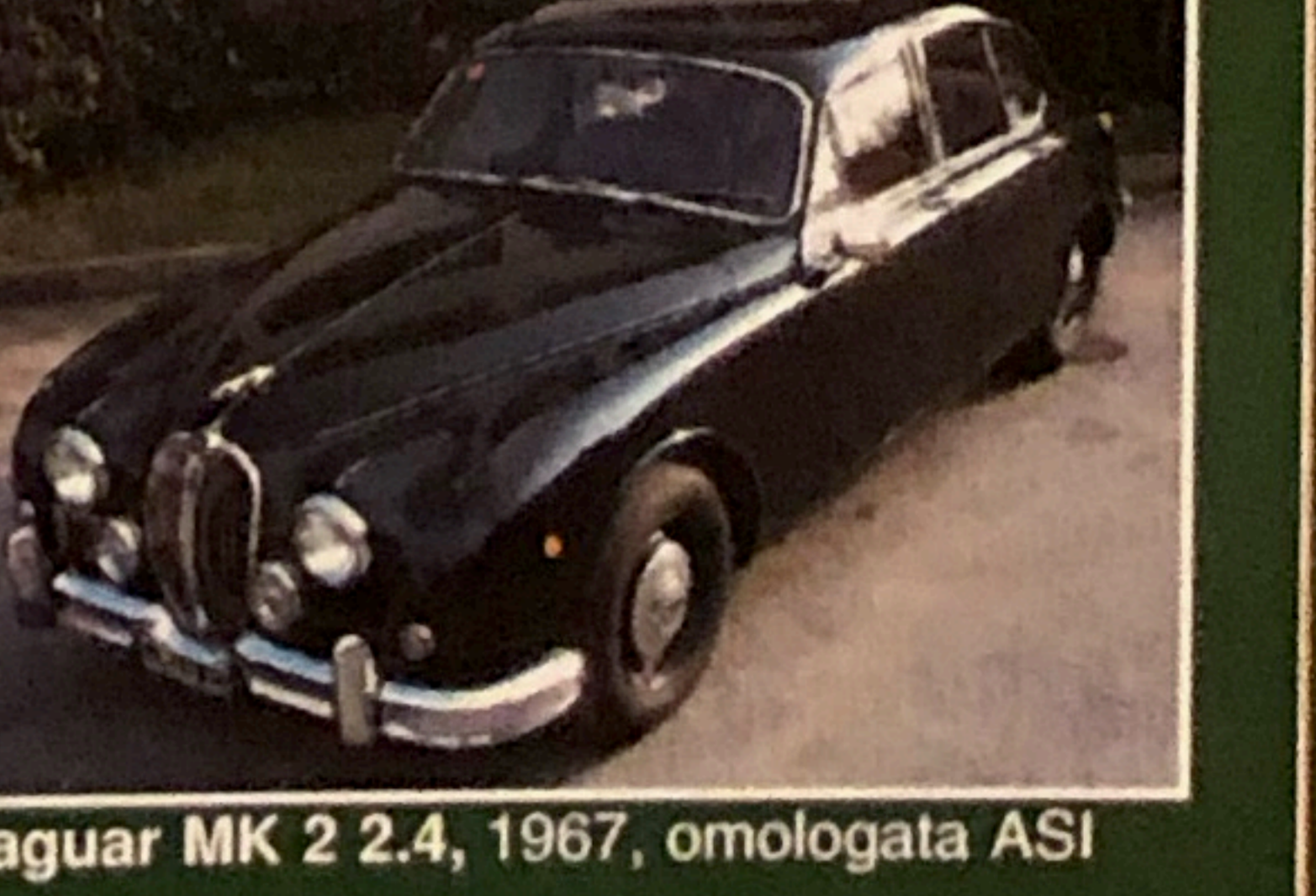
Jaguar MK 2 2.4, 1967, omologata ASI