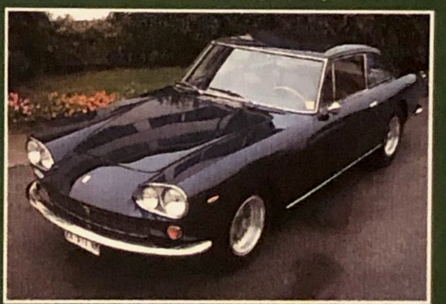
Ferrari 330 GT, 1964, perfette condizioni di meccanica e carrozzeria