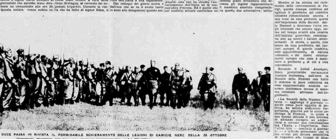
IL DUCE PASSA IN RIVISTA IL FORMIDABILE SCHIERAMENTO DELLE LEGIONI DI CAMICIE NERE DELLA 28 OTTOBRE (FOTOGRAFIA TRASMESSA PER FILO ALLA STAZIONE TELEFONICA DI LA STAMPA)