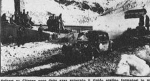
Sibert su Citroen poco dopo aver superato il ripido scosceso fermatosi in un punto dell'accidentato percorso in seguito al continuo passaggio delle vetture.