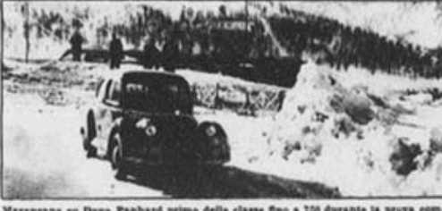
Maranzana su Dyma Panhard primo della classe fino a 750 durante la prova complementare. Grazie ai veloci e regolari tempi guadagnava molti punti in classifica.