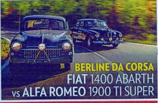
BERLINE DA CORSA FIAT 1400 ABARTH vs ALFA ROMEO 1900 TI SUPER