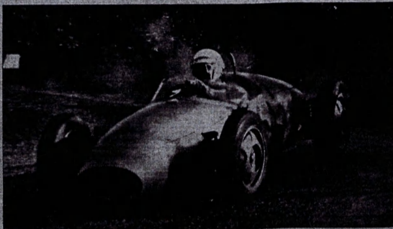
Anzio Zucchi su Junior B.F.

il (Bandini) in 3'42"7, media km. 64,660; 2. Bandini (Bandini) 3'43" — Classe 2000 cc.: 1. Wall Ever (Osca 1500) in 3'39"5; 2. Boffa Mennato (Maserati 2000) 3'40" — Categoria Junior: 1. Zucchi (B.F.) in 3'34"9; 3. Canali (Bandini) 3'42"7.