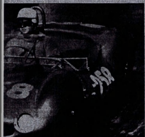
... su Maserati «2000».