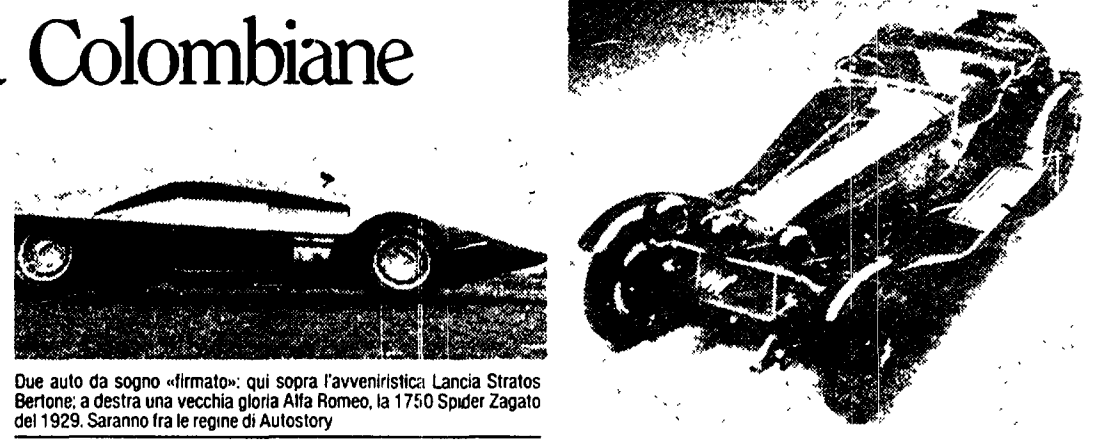
Due auto da sogno «firmate»: qui sopra l'avveniristica Lancia Stratos Bertone; a destra una vecchia gloria Alfa Romeo, la 1750 Spider Zagato del 1929. Saranno fra le regine di Autostory