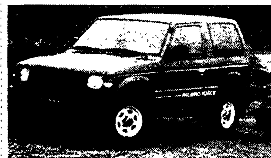
DAL NOSTRO INVIATO ROSSELLA DALLO'