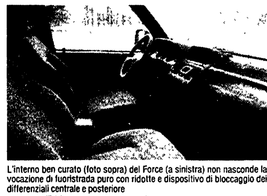
L'interno ben curato (foto sopra) del Force (a sinistra) non nasconde la vocazione di fuoristrada puro con ridotte e dispositivo di bloccaggio dei differenziali centrale e posteriore

metropolitane, la BK ci ha sottoposto a un duro impatto (è il caso di dirlo) con i percorsi, accidentati e irti di difficoltà, tipici delle gare organizzate dalla FIF.