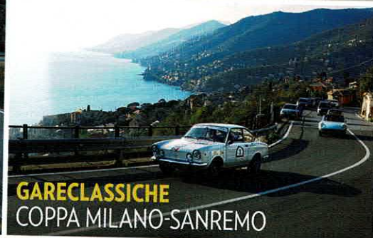
GARECLASSICHE COPPA MILANO-SANREMO

STORIA 50 ANNI FA I PRIMI MOTI DI MAGGIO A PARIGI: AUTOMOBILI E RIVOLUZIONE NEL 1968 ASTE FINARTE MILLE MIGLIA, BONHAMS GOODWOOD MEMBERS' MEETING, BOLAFFI A MILANO