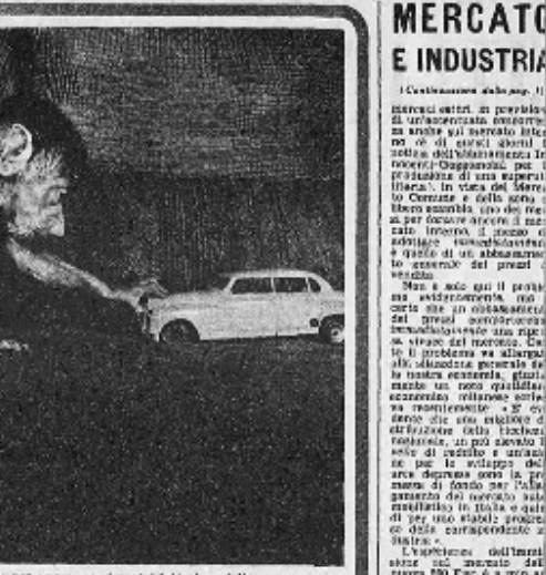
Un portafoglio vivente per agguantare al nostro belletti un felice anno nuovo.

È una filosofia che ci dà un senso di orgoglio e di自豪. È una filosofia che ci insegna a lottare, a superare i limiti, a raggiungere i nostri obiettivi.