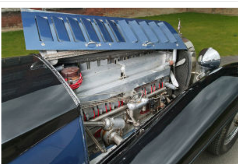
Ein Monument von Motor: 1,4 Meter lang, Zylinderkopf und Block aus einem Stück, knapp 13 Liter Hubraum, etwa 300 PS.