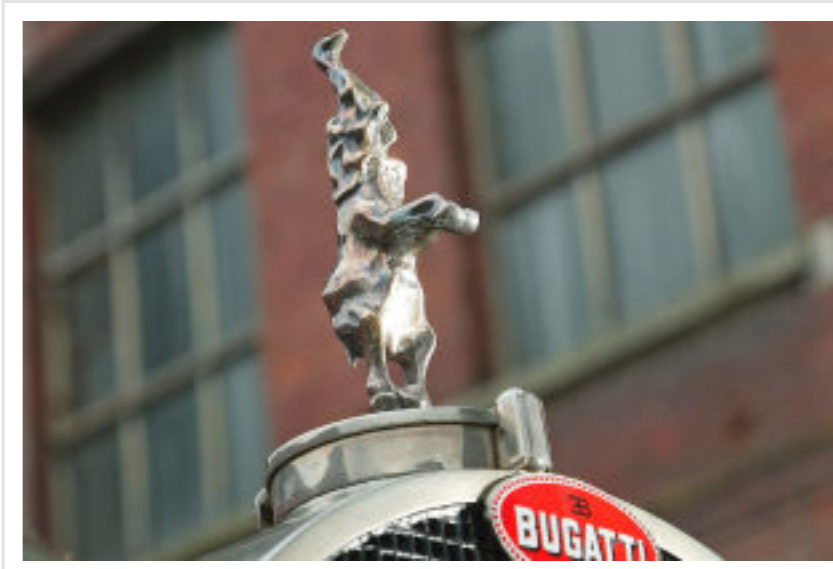
Als Gag pflanzte Ettore eine Elefantenskulptur auf den Kühler, um die Rolls-Royce-"Emily" zu persiflieren.

wie die Mona Lisa. Jedoch soll sich das sechs Meter lange Schiff ziemlich einfach fahren lassen, auch wenn seine Kernkompetenz im Herumstehen liegt. Bei Tempo zehn in den zweiten Gang schalten (links oben), der reicht bis 150, den Dritten (links unten) kann man getrost vergessen, denn über 120, nein, das gehört sich nicht. Die Betriebskosten sind hoch, bis zu 50 Liter können es auf 100 Kilometer sein. Immerhin: Er hat einen 190-Liter-Tank. Der robuste Motor fasst zudem 14 Liter Öl und 48 Liter Wasser.