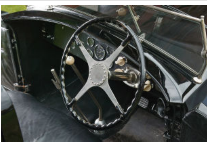
Das Lenkrad so groß, als wär's eine Jacht, damit auch Damen klarkamen. Die Blechtröte rechts unten ist die Gegensprechanlage nach hinten.