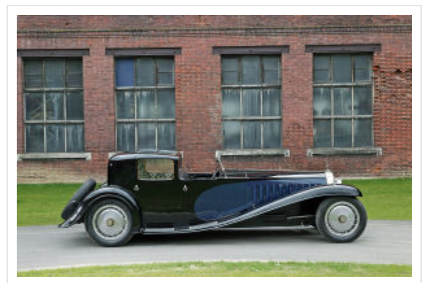
Bekanntester Royale ist das "Coupé Napoléon", Chauffeur im Freien, Herrschaft im Plüschsalon.

Zur Orientierung: Ein Bugatti 57 SC Atlantic ging 2010 für 20 Millionen Euro über den Auktionstisch. Das wäre so die Größenordnung der Royale. Der erste entstand 1926 und wurde bis 1931 fünfmal neu eingekleidet, zuletzt als Coupé Napoléon (steht in der Cité de l'Automobile, Musée Nationale, Collection Schlumpf in Mulhouse). Er trägt die Fahrgestellnummer 41100, wobei die 41 für den Royale steht. Es war Ettore Bugattis Privatwagen, zu sehen auf unseren Fotos. Der Patron der Firma im elsässischen Molsheim, ein kleiner, gewitzter Italiener mit großem Ingenieurtalent und Faible für Ästhetik, manche nennen ihn ein Genie, hatte in den 1920er-Jahren mit seinen Renn- und Sportwagen enormen Erfolg. Seine Autos waren so angesagt wie heute die von Ferrari vielleicht. Das mag Ettore ein bisschen zu Kopf gestiegen sein, denn er träumte bald davon, das beste Auto der Welt zu bauen, das heißt: das größte, komfortabelste, leiseste, schnellste und teuerste. Damals war Hispano-Suiza der Platzhirsch der High Society, knapp vor Rolls-Royce , Isotta Fraschini oder Duesenberg. Bugatti wollte noch eins draufsetzen. Er konstruierte einen knapp 15 Liter großen Reihenachtzylinder mit obenliegender Nockenwelle, bei dem Motorblock und -kopf ein monolithisches Ganzes bildeten. Als Leistung wurden 300 PS geschätzt, als Höchstgeschwindigkeit 200 km/h! Und das 1926!