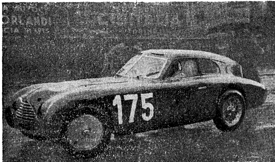
Das Cisitalia-Coupé « Mille Miglia ».

In bezug auf die Auslegung der Reglemente schienen die italienischen Behörden eher laxe zu sein. Sowohl in den Kategorien Touren- wie Sportwagen fanden wir Modifikationen, die an einem schweizerischen Rennen wohl zu einem Startverbot geführt hätten. Da wir nicht, wie Italien, eine kleine Spezialindustrie besitzen,