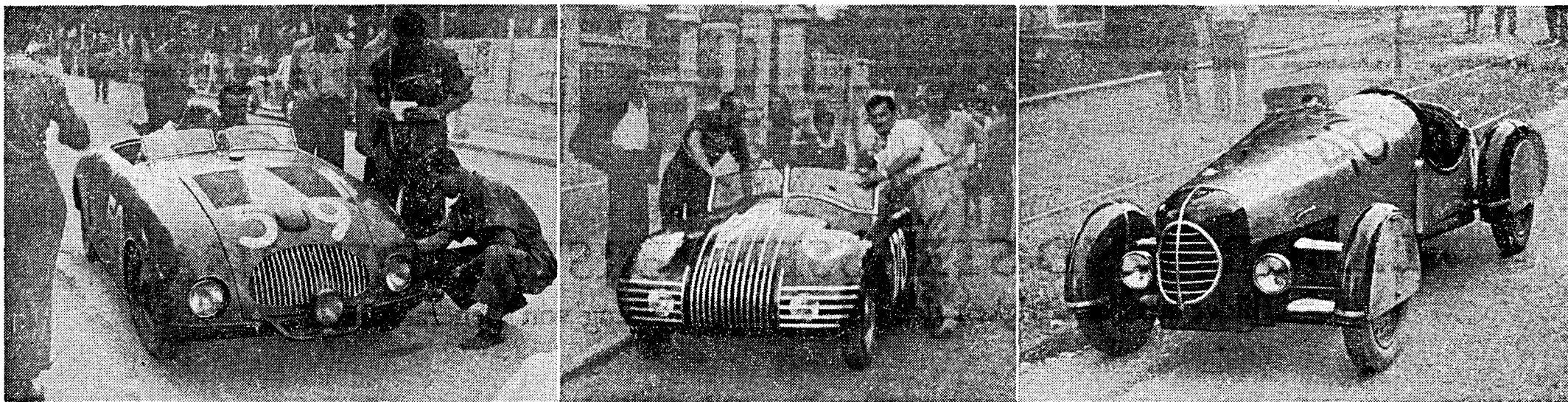
Drei « Home-made »-Mille-Miglia-Abarten des Fiat 1100.

schlechterdings hervorragend. Die auf einer Strecke von 215 km (Teil der Autostrasse Turin—Brescia) gemessene Durchschnittsgeschwindigkeit von 154 km/h, die Bernabèis Cistalia erreichte, wurde nur teilweise bei gu-