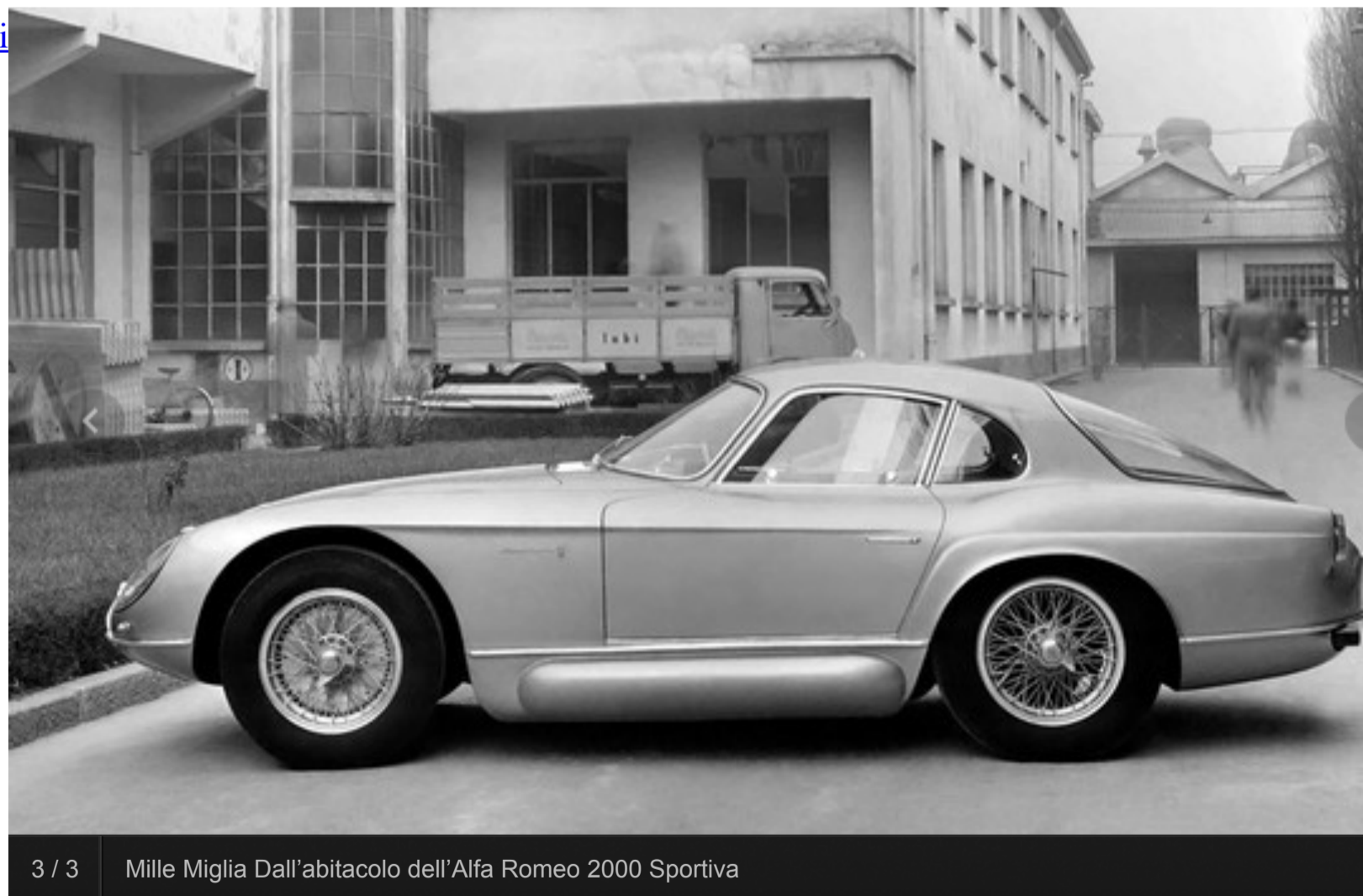
3 / 3 Mille Miglia Dall'abitacolo dell'Alfa Romeo 2000 Sportiva