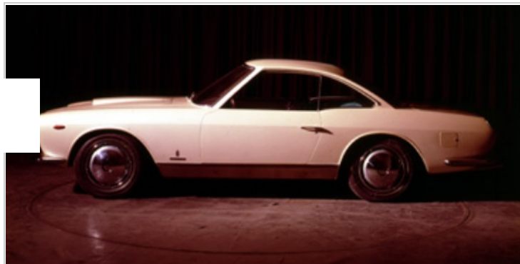
Immagine 1 di 3