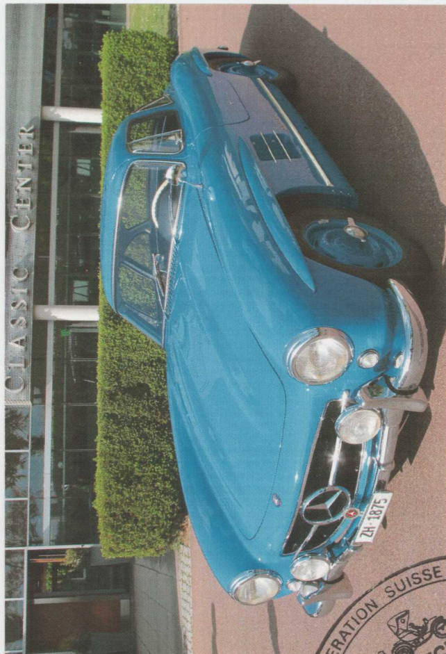
Photograph of vehicle in present form La photo du véhicule dans la forme présente

Remarks, modifications, history, etc. - see page 4. Remarques, modifications, histoire, etc. - voir page 4.