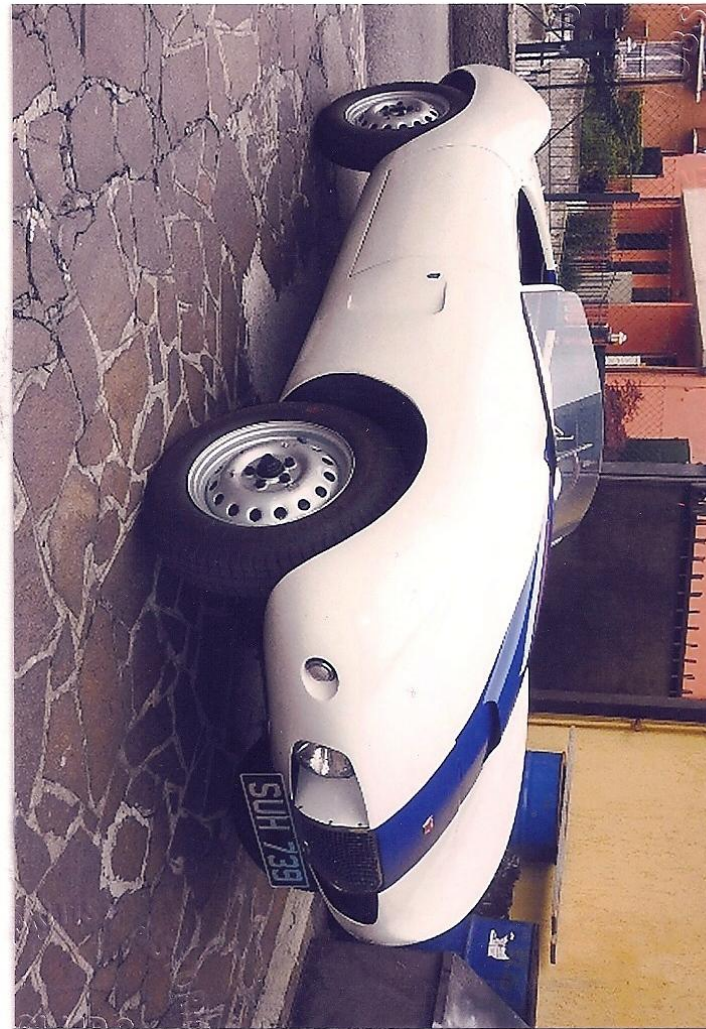
Photograph of vehicle in present form La photo du véhicule dans la forme présente

Remarks, modifications, history, etc. – see page 4. Remarques, modifications, histoire, etc. – voir page 4.