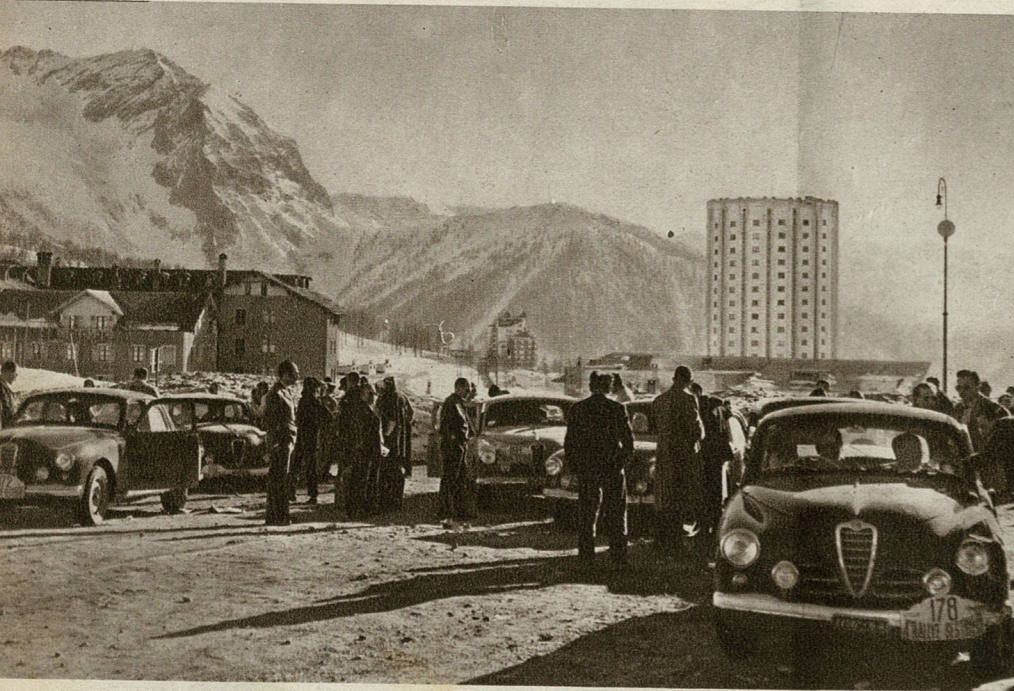
Le macchine dei concorrenti al Parco chiuso del Sestriere.

« Rallye (dice l'articolo 19 bis del Co. dice Sportivo Internazionale) è una prova di durata a velocità media limitata, in cui l'itinerario, o gli itinerari convergono verso un prefissato punto di raduno, e nella quale la più alta velocità sulla strada non deve costituire un fattore di classifica. Tuttavia, una o più prove ammesse di velocità, possono far parte del programma di un Rallye ».